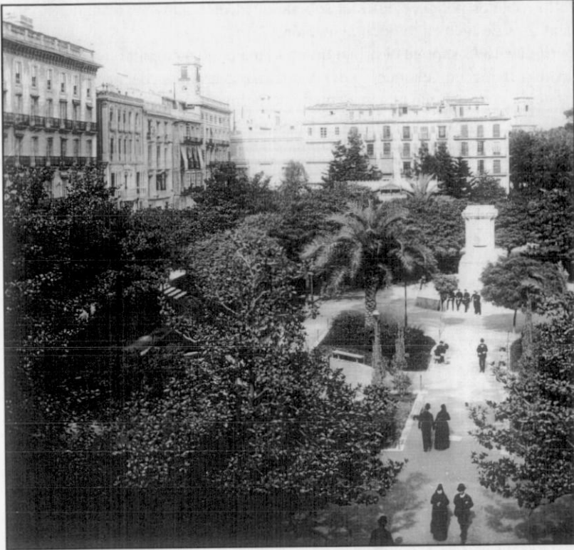
Figura II.- El pedestal del monumento al rey Jaime I en el Parterre valenciano sin el grupo escultórico en fotografía de Lévy en 1888.

les 8 . En el mes de julio de 1876, antes de los días de las celebraciones, la Municipalidad tomaba las últimas resoluciones sobre las mismas 9 . Así determinaba principalmente que la exposición de objetos del rey Jaime I se celebrara en el salón de Cortes de la Audiencia previa visura por el arquitecto municipal, si bien una semana más tarde, ante una comunicación de este último, solventaba ocurriese en el salón columnario de la Casa Lonja , que la propia comisión de Centenar en vista de los antecedentes que obraban en el archivo marcara el ceremonial a observarse para sacar la real Señera, que se colocase el pendón de Valencia en el carro fúnebre que ha de llevar a la catedral los demás objetos históricos pertenecientes al citado monarca, así como la habilitación de la persona que se incautase en Madrid