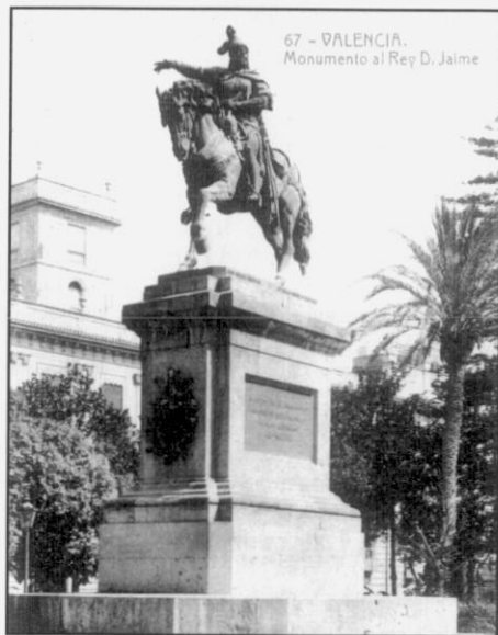
Figura I.- Monumento al rey Jaime I el Conquistador en el Parterre de Valencia, en tarjeta postal de principios del siglo XX.

Desde que Donatello con su condotiero Gattamelata , primero, y Verrocchio con su Bartolomeo Colleoni, después, rescatasen de la