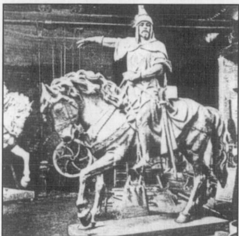
Figura III.- El monumento bronceo recién fundido a fines de 1890, en los talleres de la "La Maquinista Valenciana", junto al prototipo ligneo de Agapito Vallmitjana al fondo.

kilogramos de bronce en las citadas piezas de artillería cedidas por el Estado y que ya se hallaban en sus talleres, corriendo a cuenta de los dichos a más del moldeado y fundición, el armado, traslación y colocación sobre el pedestal, con otros pormenores establecidos en el convenio, como lo referente a la modificación de los apartados once, respecto a la obligación de los contratados de trasladar el modelo desde Barcelona, o el doce, respecto al pago de la suma por su trabajo en los ejercicios económicos dispuestos por el Consistorio (Apéndice Documental II) 20 .