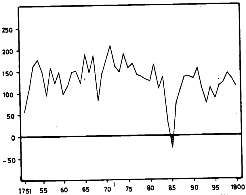
Fig. 2.— Algemesí. Evolució del creixement vegetatiu en el període 1751-1800