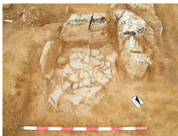
Fig. 2. Tinaja con pitorro vertedor rota dentro de la estructura 2007.

El departamento 2, bastante más pequeño (3,5 x 2,75 m; 9,6 m 2 ), paralelo al anterior y ubicado en la parte más oriental del Sector, está delimitado de nuevo por tres muros, las UUEE 1019 y 1020, muros paralelos de orientación N-S, cerrados por el Sur por 1018. En su construcción destaca la utilización de grandes losas de piedra. Bajo el muro oriental la roca fue recortada para luego situar las grandes losas encima y conformar un muro más consistente. De nuevo el nivel de pavimento estaría sobre la roca, tal y como indica la presencia de un agujero de poste. Aunque éste no está en posición central, no cabe duda sobre su función, pudiéndose relacionar con alguna reparación de urgencia que se tuviera que hacer en el techo o en alguna de las paredes. En el interior del mismo se pudieron diferenciar dos niveles: la UE 1016, correspondiente al nivel de abandono/ derrumbe, y la UE 1015,