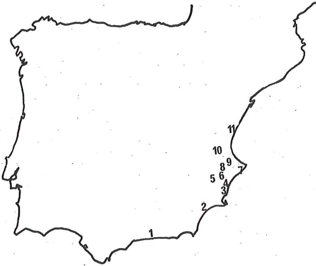
Fig. 1.—Localización de los yacimientos mencionados en el texto: 1, Cueva de Nerja (Neolítico); 2, El Gárcel (Neolítico); 3, La Figuera Redona, Elche (Calcolítico); 4, Serra Grossa, Alicante (Edad del Bronce); 5, Arenal de la Virgen y Casa de Lara, Villena (Calcolítico); 6, Peñón de Caro Xita, Torremanzanas (Calcolítico); 7, Cova de la Cendra, Moraira (Neolítico a Bronce); 8, Cova de l'Or, Beniarrés (Neolítico); 9, Cova d'en Pardo, Benissili (Neolítico y Calcolítico); 10, La Ereta del Pedregal (Calcolítico); 11, Pic dels Corbs (Edad del Bronce).

fuera el Calcolítico valenciano 9 . Ninguna evidencia de cronología absoluta, no obstante, nos permitía elevar las fechas calcolíticas, y aunque en la base aceptábamos plenamente las altas fechas dadas por Savory para las cuevas más notables del Calcolítico valenciano 10 , no era factible el defenderlas con argu-