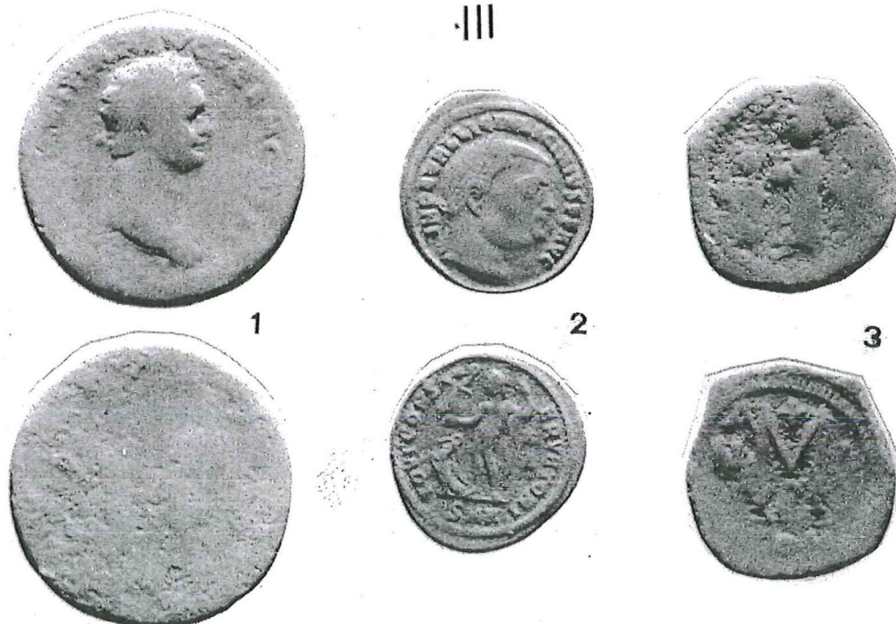
Lámina II. Monedas halladas en Acci. Series II y III.