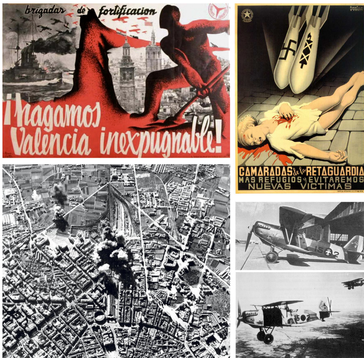
Fig. 1. Dalt: cartell d'Alcaraz: "¡Hagamos Valencia inexpugnable! Brigadas de fortificación" i cartell de Parrilla "Camaradas de la retaguardia más refugios y evitaremos nuevas víctimas". Sota: bombardeig sobre l'Estació del Nord a València; vista lateral en terra d'un HE-45 del grup 6-G-15 de l'aviació nacional i vista lateral en vol d'un HE-45 (Pavo) durant la Guerra Civil Espanyola.

el vist i plau d'un arquitecte eren rebutjats per la Junta de Defensa, tal i com reflecteixen els documents de l'Arxiu. Sovint els refugis van tardar molt en acabar-se, degut a un sistema de construcció calculada i conscient del paper que havien de complir. Estem davant d'una construcció portada a terme de forma rigorosa i amb un alt nivell tècnic, que segueix pautes i models constructius. La reiteració dels bombardejos, però, va provocar queixes per la