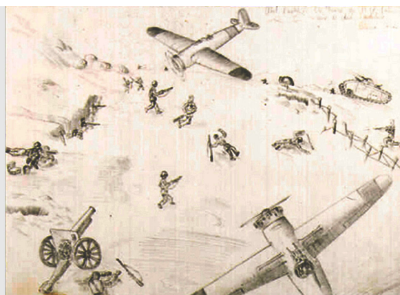
> Abel Puche, gener 1938, 14 anys, Institut "Blasco Ybañez" (València).