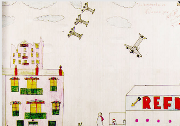
> Gaspar Romero, 11 anys, 1er any Curs B (València).