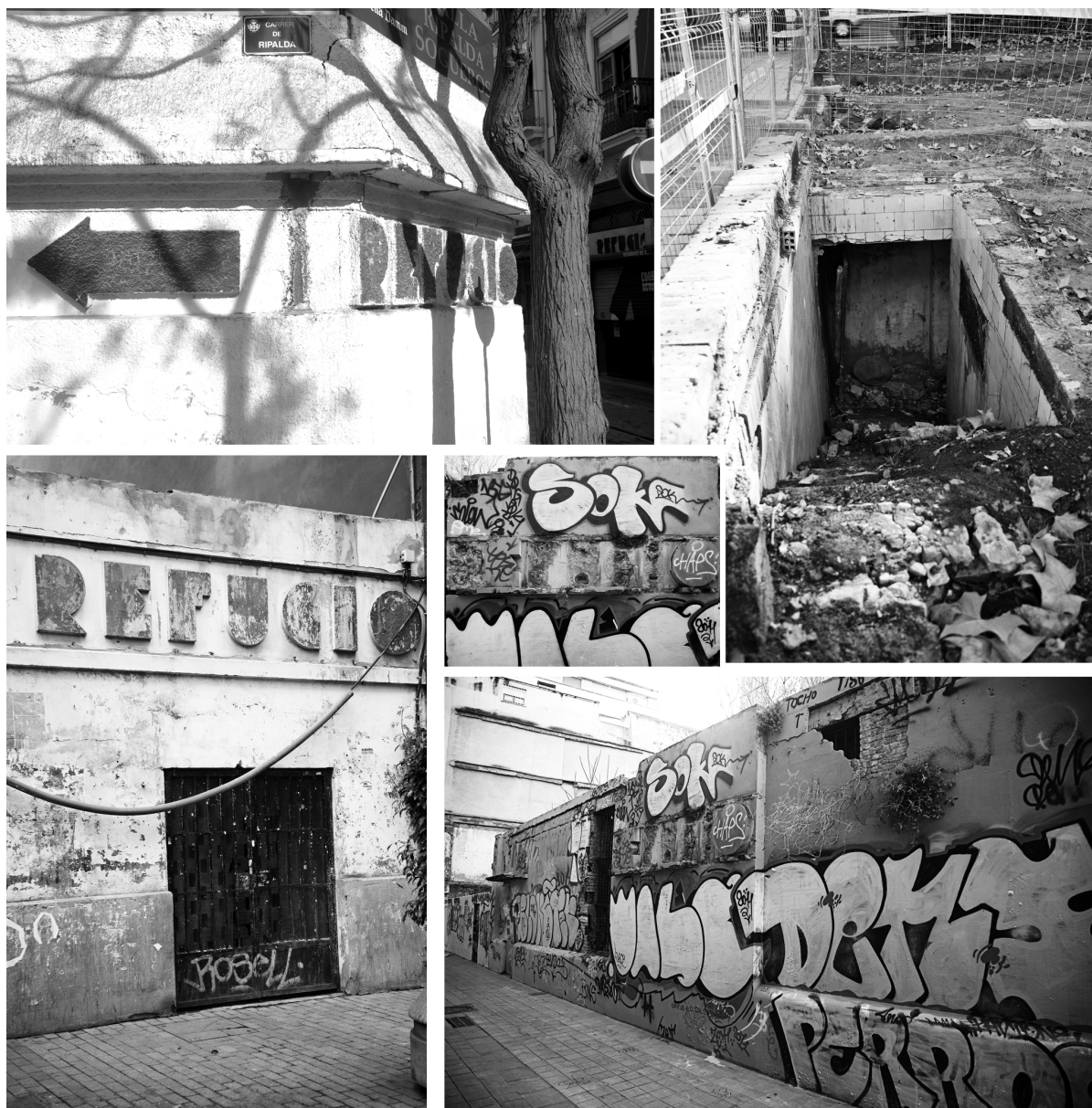
Fig. 2. Refugi carrer Alt-Ripalda amb detall de la fletxa assenyalant l'entrada; (Sota) entrada tapiada del refugi del carrer Serrans; (dalt-dreta) refugi desenterrat gener 2011 a la Gran Via Marqués del Túria, entre els carrers Comte Salvatierra i Jorge Juan, detall de l'entrada; (sota) detall del nefast estat de conservació de la façana i el rètol original del refugi del carrer de L'Espasa (Fotos: Hèctor Juan, a data de gener de 2011).