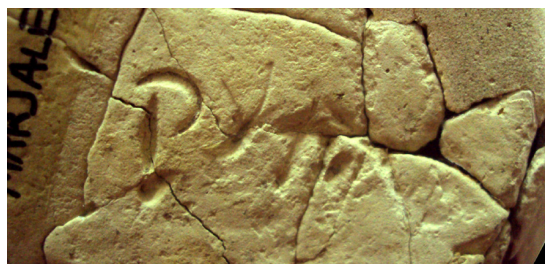
Fig. 3. Inscripción incisa.

Esta pieza es del tipo Loeschcke IC (1919), que se fecha en época Neroniana-Flavia, aunque su producción en las provincias tuvo un especial auge a partir de la etapa flavia (70-96 d.C.). Esta forma se corresponde con la