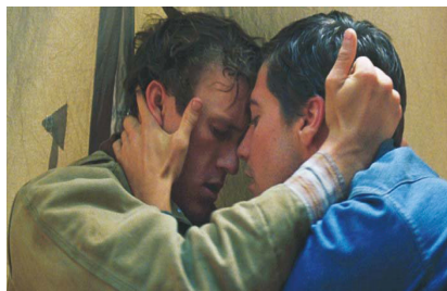
Tabla 5. Primer encuentro sexual de los personajes