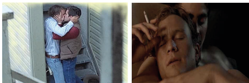
Tabla 6. Reencuentro de los personajes

Leemos una y otra vez las palabras de Proulx y, sin poder remediarlo, la sordidez de la descripción se apodera de nosotros cada vez más, y la historia nos atrapa. Las imágenes que reescriben las palabras, consi-