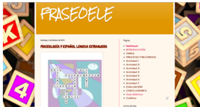
Imagen 2. FRASEOELE: webquest para la fraseodidáctica en E/LE.

Se abre con una página principal que contiene el título desglosado de la actividad (Fraseología y Español Lengua Extranjera) y una imagen que representa una sopa de letras que tiene la función de captar la atención del alumnado.