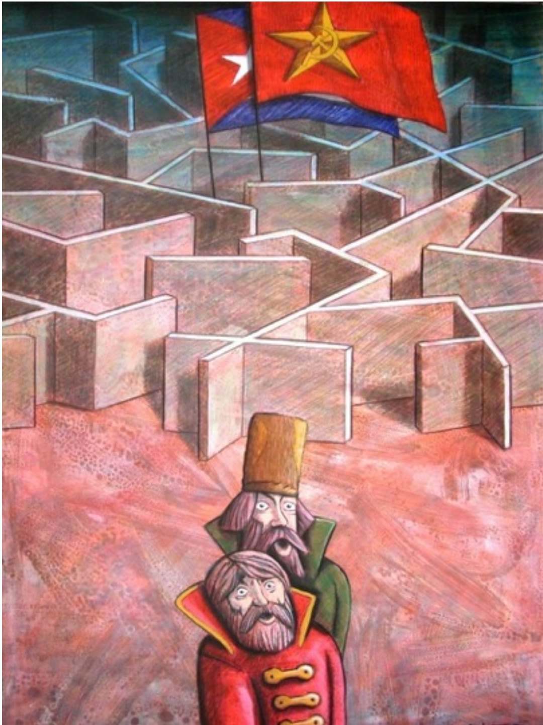
Sin título. Alain Martínez Menéndez (Mixta sobre papel 50x70)