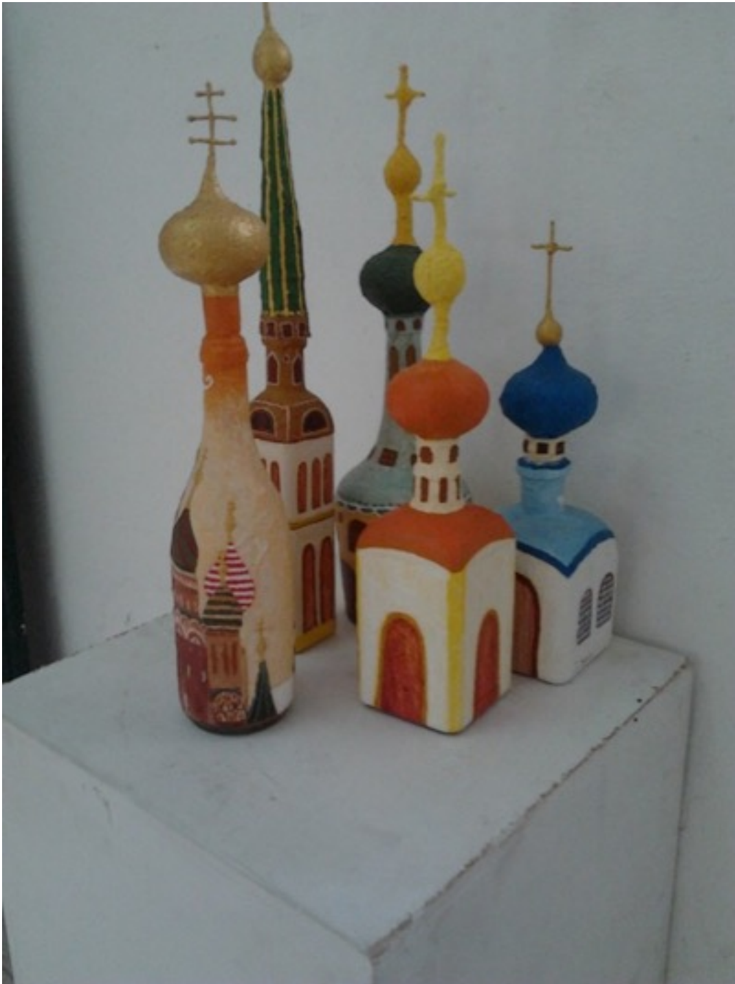
Jorge Luis Sanfiel. (Instalacion con botellas pintadas y papier mache. Dimensiones variables)