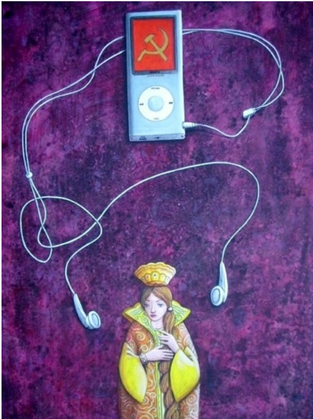
Sin título. Alain Martínez Menéndez (Mixta sobre papel. 50 x70)