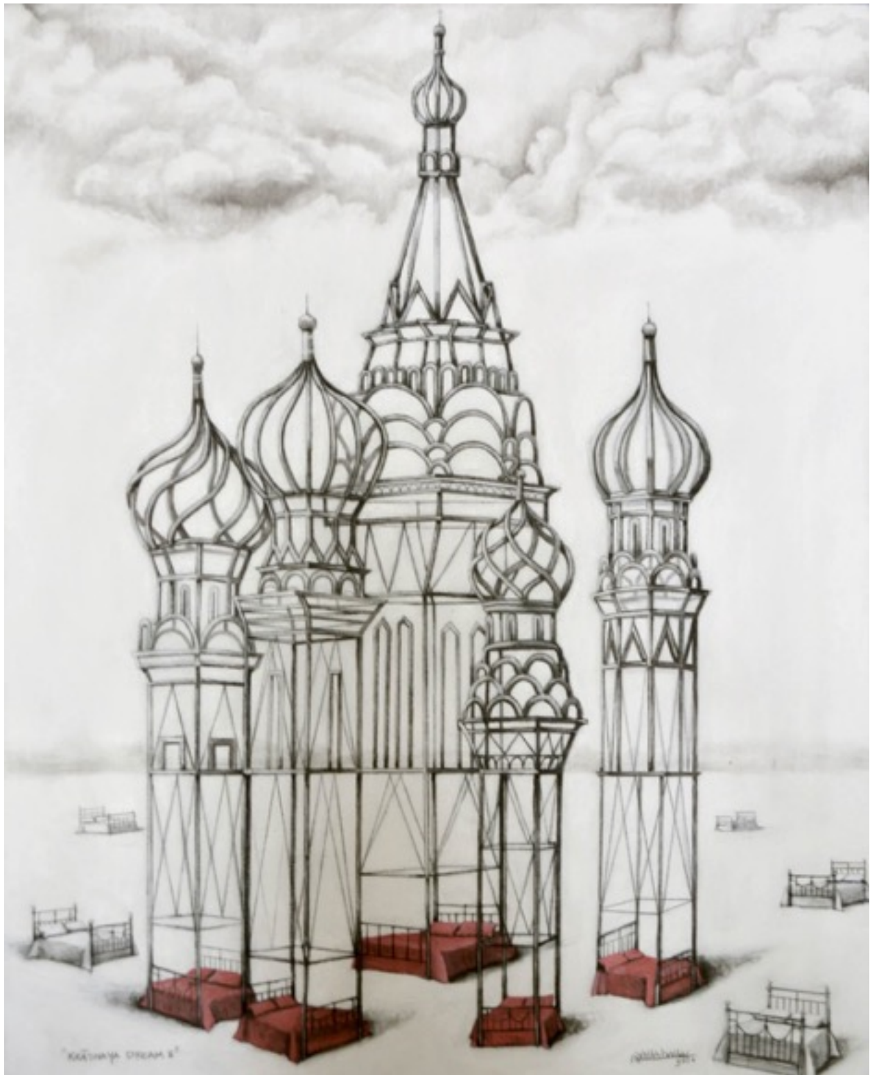
Krasnaya dream 2. Camilo Villalvilla