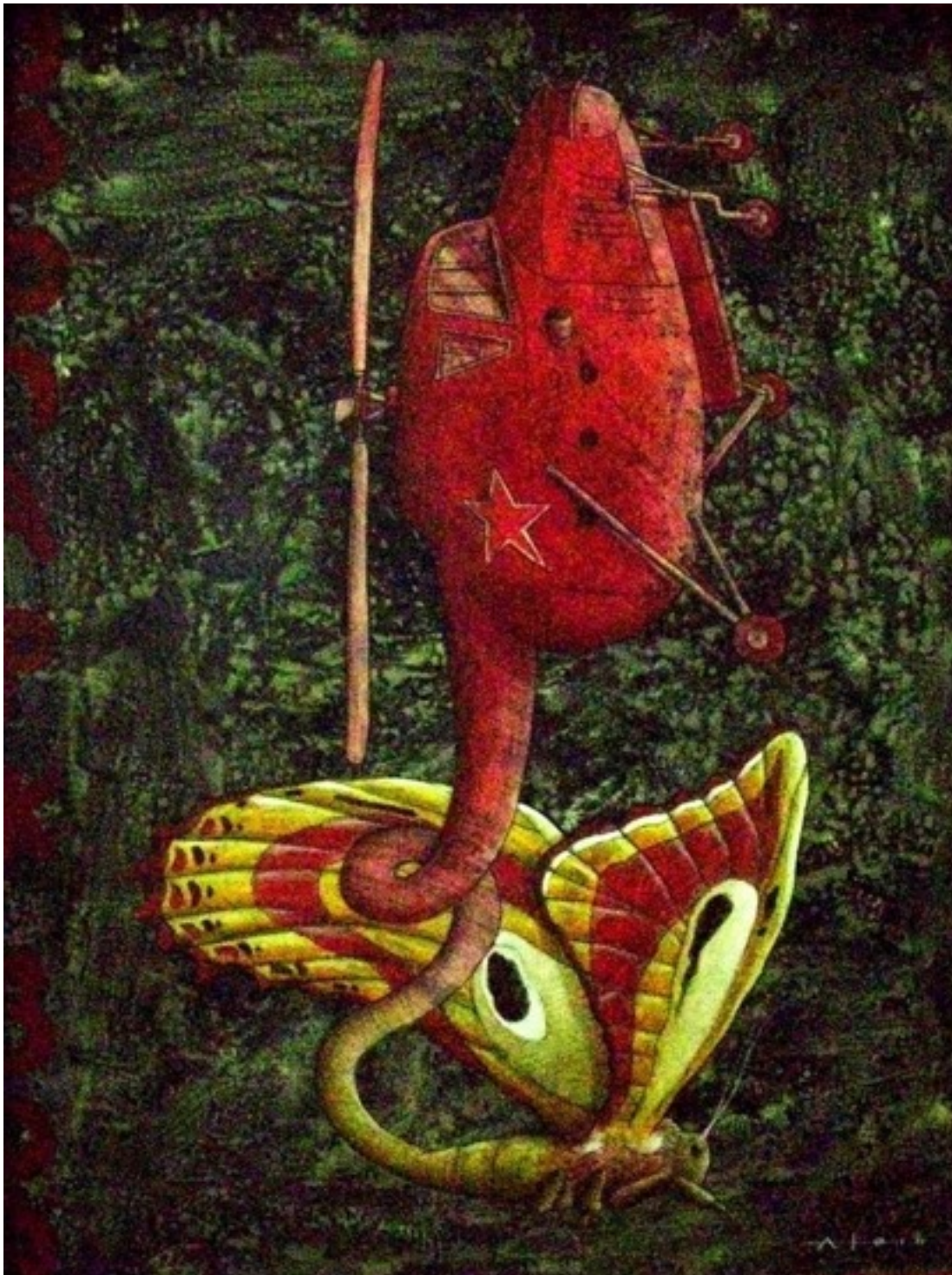
Alain Martínez Menéndez (Mixta sobre papel. 50x70)