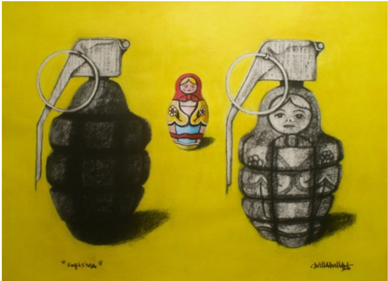
Sofisma . Camilo Villalvilla (Carboncillo y acrílico sobre cartulina. 81 x 60)