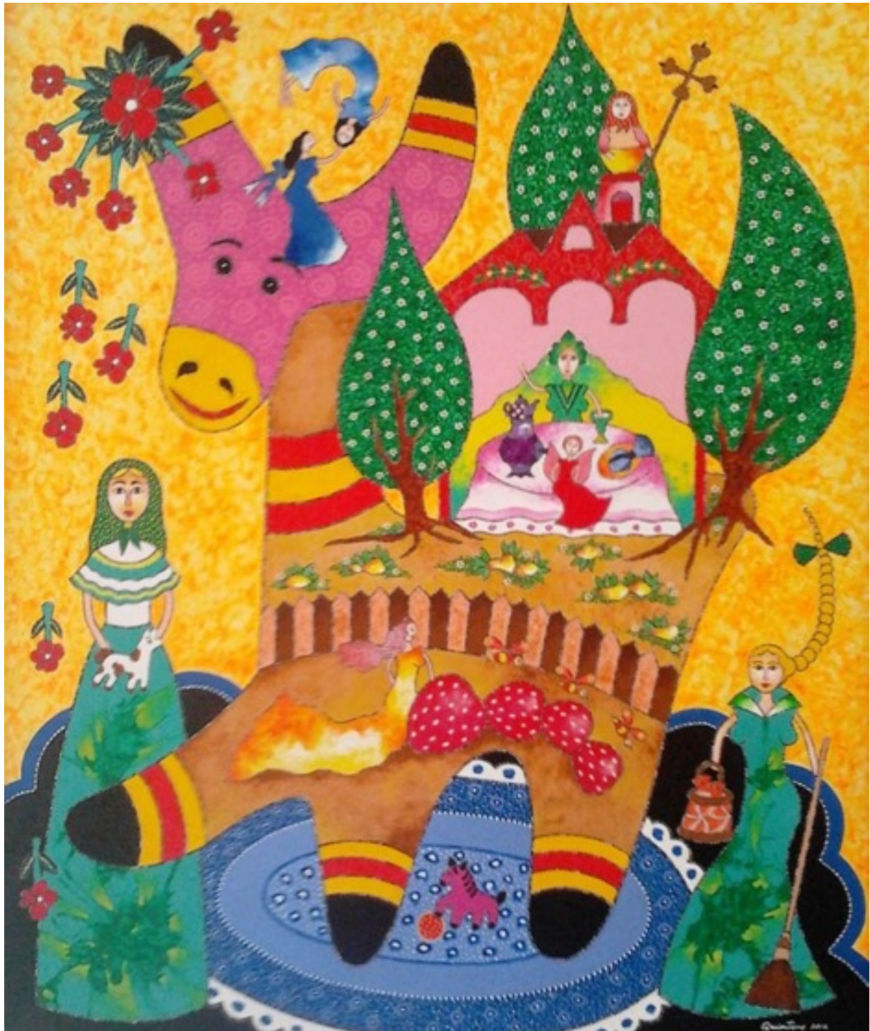
Rolando Quintero (Acrílico sobre lienzo)