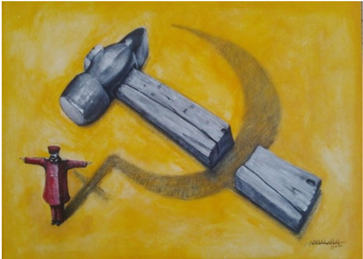
Hoz, martillo, sombra. Camilo Villalvilla (Carboncillo y acrílico sobre lienzo). 40 x 67 cm)