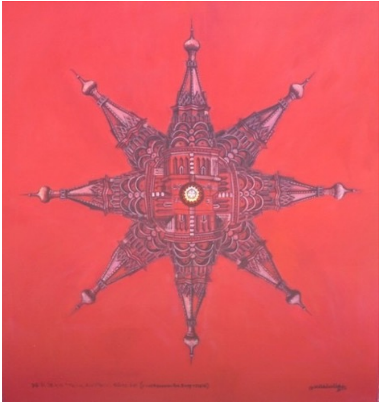
Construcción imposible. Camilo Villalvilla