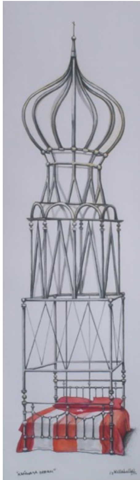
Krásnaya dream. Camilo Villalvilla (Acuarela sobre papel. 100x30 cm)