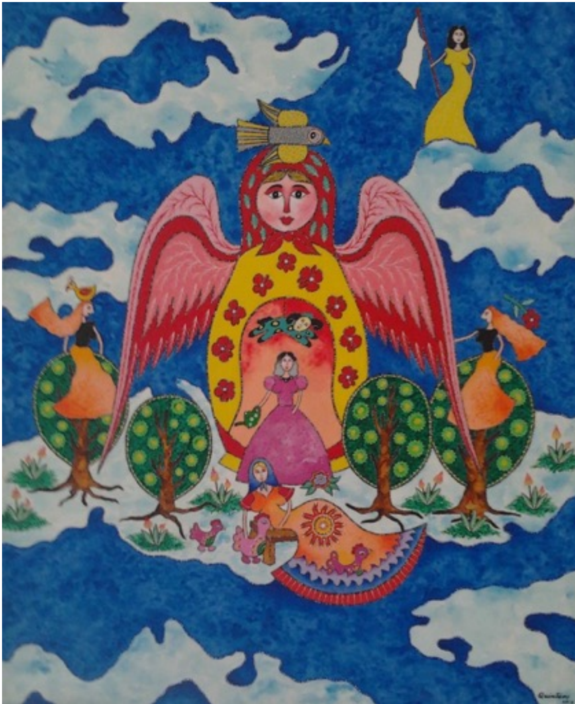
Rolando Quintero (Acrílico sobre lienzo)