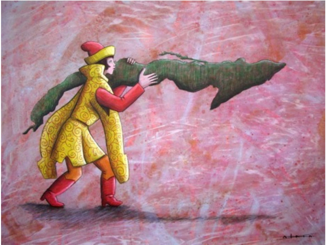
Alain Martínez Menéndez (Mixta sobre papel. 70x50)