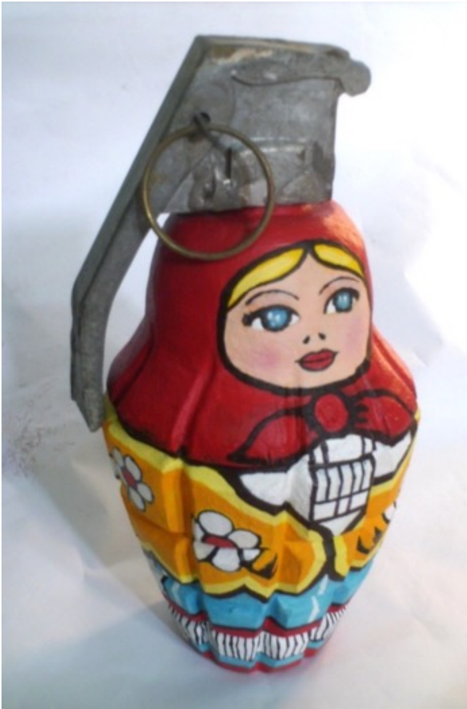
Sofisma, (proceso). Camilo Villalvilla (Cermica y metal policromado. 28 x 145 x 14cm)