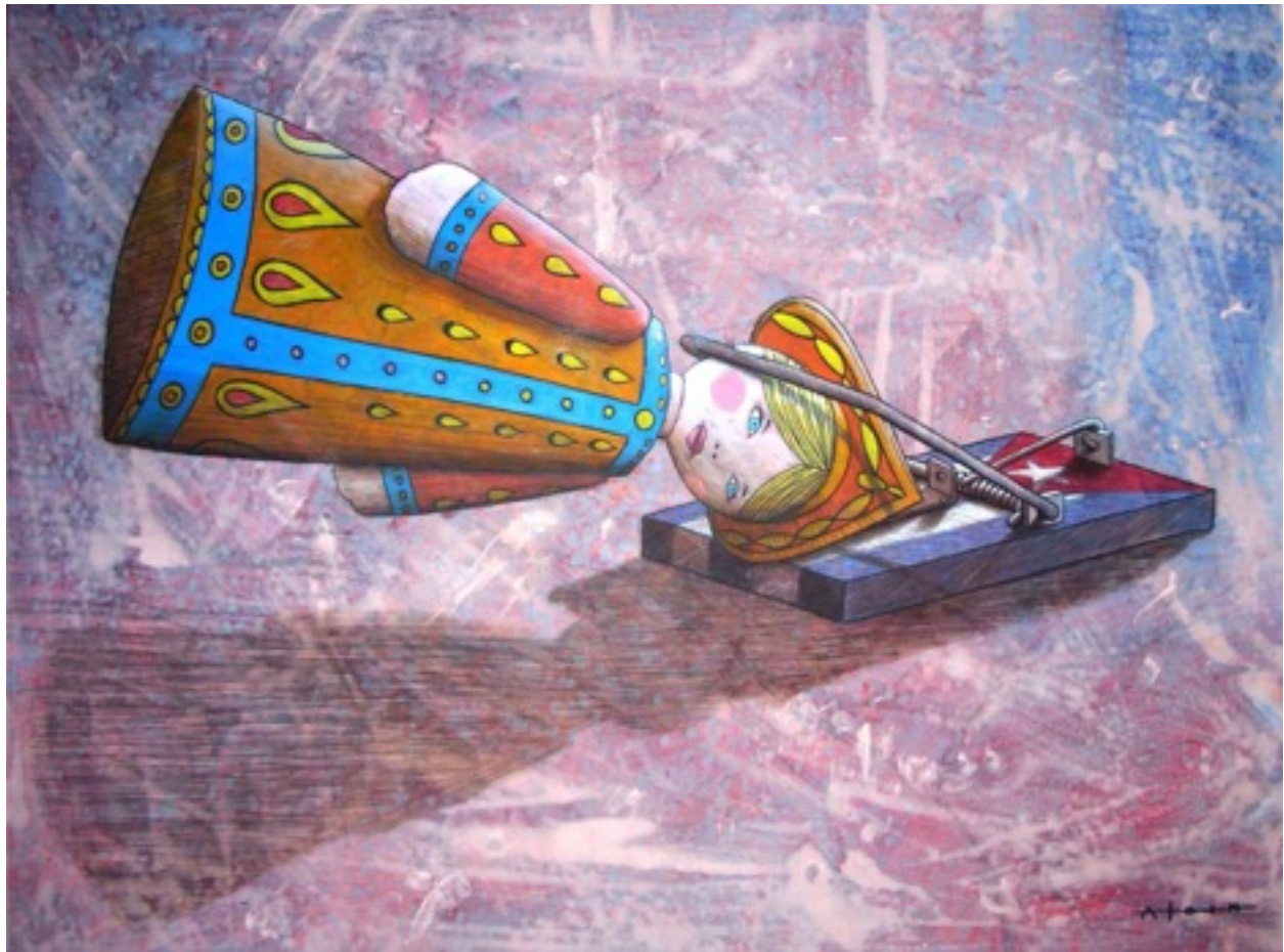
Sin título. Alain Martínez Menéndez (Mixta sobre papel. 70x50)