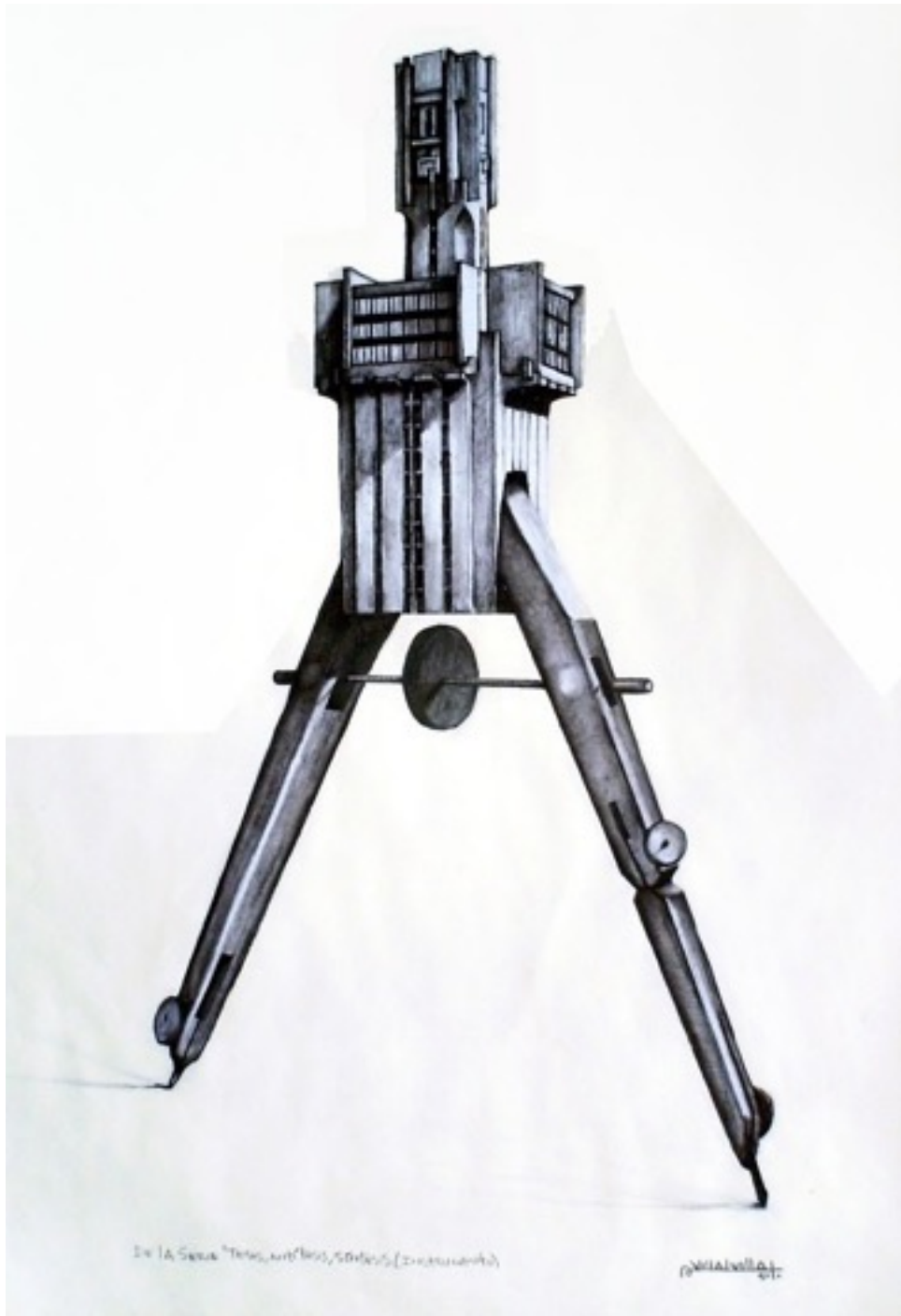
De la serie Tesis, antítesis, síntesis . Camilo Villalvilla (100 x 70 cm carboncillo sobre papel)