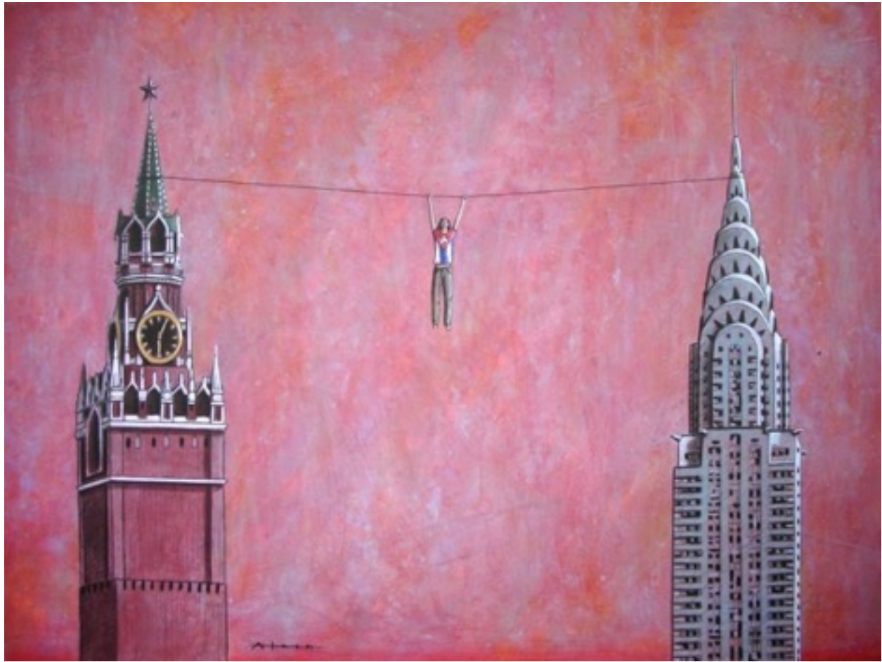
Sin título. Alain Martínez Menéndez (Mixta sobre papel. 70x50)