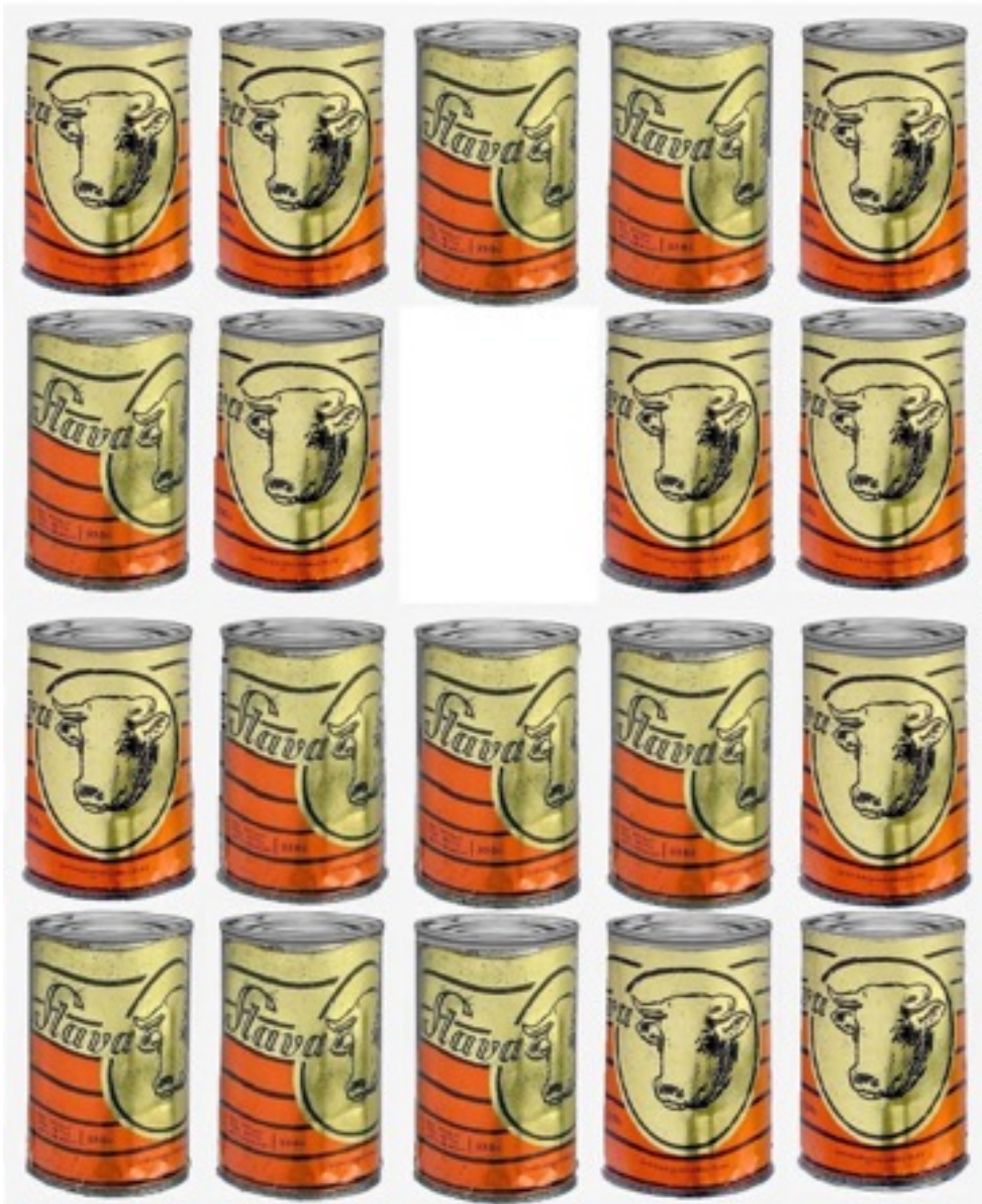
Diseno: Camilo Villalvilla. Curaduria y Montaje: Miguel Angel Rodriguez y Celia Joya