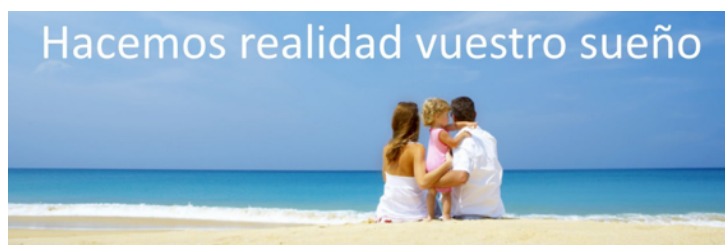
Imagen 2. Fuente: publicidad de una clínica de fertilidad privada.

A diferencia del centro imaginado por Huxley, en donde el vínculo familiar queda deshecho y abolido, la clínica de fertilidad es un espacio que consagra modelos de familia. Según Thompson (2002b), en sus prácticas se subraya cierta comprensión del parentesco mientras que se minimizan, e incluso se eliminan, otras formas de creación de vínculos humanos destinados a la crianza. En función de los usos y de la normativa de cada país, la clínica de fertilidad ofrece sus tratamientos a aquellas unidades familiares que se ajustan a los modelos autorizados, consolidando y reproduciendo determinadas concepciones de lo que es una familia. Los tres ejemplos siguientes, que forman parte