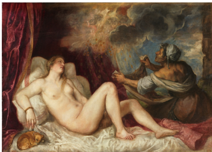
Imagen 4. Tiziano, Dánae recibiendo la lluvia de oro (1560-1565), Museo del Prado.

atadas a su cintura las llaves de la reproducción, que sitúan su deseo de ser madre en el terreno de lo científicamente factible.