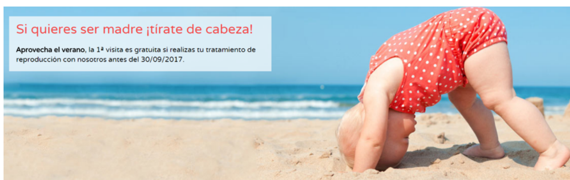
Imagen 3.

Igual que el balneario de Kundera, la clínica de fertilidad no se entiende a sí misma como un enclave de disrupción del orden familiar establecido, sino como un espacio hospitalario de fines continuistas, que se amolda al sistema de parentesco avalado y practicado por la sociedad, a la que se propone darle las satisfacciones reproductivas que no se pueden o no se quieren obtener por medio del coito heterosexual. Su tarea se concibe en términos de ayuda, ya sea en forma de servicio asistencial –procurado gratuitamente por un sistema de sanidad público–, o mediante el pago de servicios –cuando se recurre a una clínica de fertilidad privada que ofrece sus productos en el mercado (Imagen 3)–: