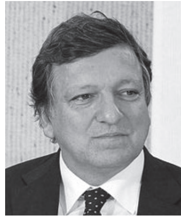
José Manuel Durão Barroso