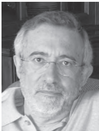
Pedro Ruiz Torres

Pedro Ruiz Torres es Catedrático de Historia contemporánea en la Universitat de València. Estudi General, institución de la que fue Vicerrector de Ordenación Académica entre 1986 y 1990 y Rector entre 1994 y 2002. Presidente de la Asociación de Historia Contemporánea y director de las publicaciones Ayer y Pasajes de Pensamiento Contemporáneo , ha publicado diversos estudios sobre la crisis del antiguo régimen y la revolución liberal, y en relación con el siglo XVIII los libros Señores y propietarios: cambio social en el sur del País Valenciano 1650-1850 (1981) y La época de la razón (1993). Entre otras obras ha coordinado Història del País Valencià. Epoca contemporània (1990) y Europa en su historia (1993). En la actualidad trabaja sobre dos líneas de investigación, los usos públicos de la Historia y el reformismo social en Europa.