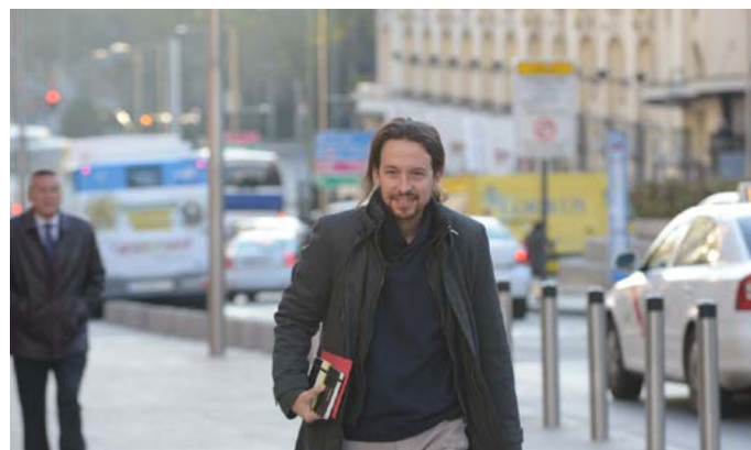
Imagen con la que se ilustra el texto «Defender la belleza (...)» en la web de Podemos.

sias— es evidente: acabar con Podemos, desgastarnos al atacar aquello que nos diferencia del resto de actores: la unidad y la belleza de nuestro proyecto político» 6 . Ideas que inevitablemente evocan un pasado anterior a la disyuntiva arte-vida .