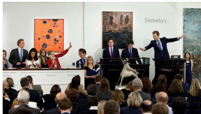
En las subastas se vislumbra la naturaleza transestética del arte contemporáneo en su máxima expresión.