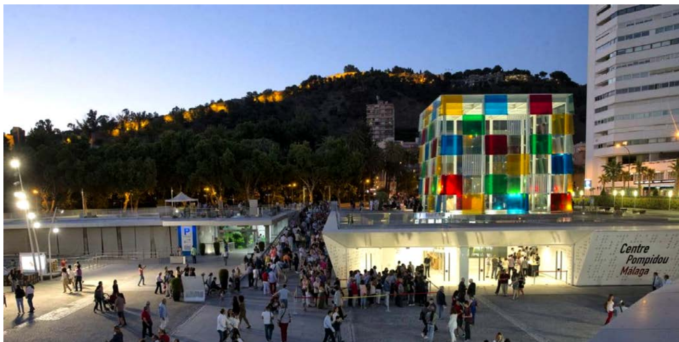
Centro Pompidou de Málaga, ejemplo paradigmático de la turistización del arte contemporáneo, tecnología que, en términos económicos, intenta rentabilizar al máximo aparatos ideológicos como el museo.

las industrias culturales, la nueva mentalidad publicitaria (2015: 108-187). Sin embargo, la lectura de estos dos autores no constituye algo completamente original, sino que debiera remontarse al menos hasta las ideas que Jean Baudrillard planteaba en su ensayo titulado precisamente «Transtética», recogido junto a otros en La transparencia del mal: Ensayo sobre los fenómenos extremos , publicado en francés en 1990.