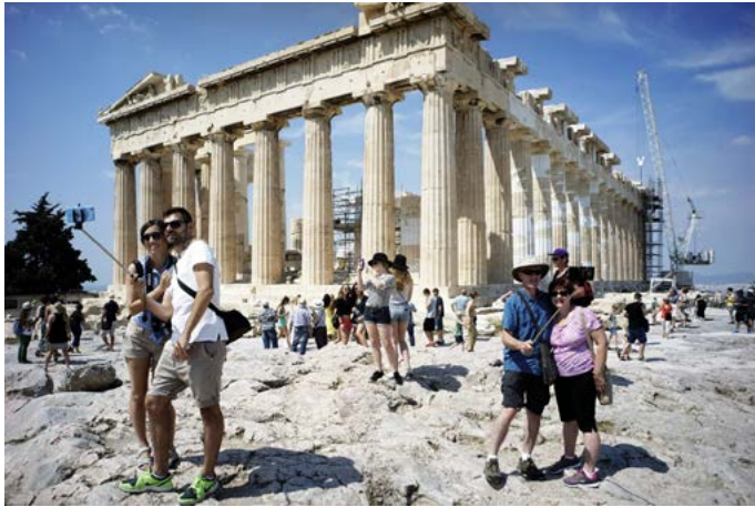
Ahí estuve yo, culturizándome.

buyendo capacidades exclusivas a determinados objetos o individuos? El «Estado seductor» actual establece las condiciones necesarias para la seducción, pero también para la autosedución del individuo, de forma que este se ha convertido en un agente activo lejos de la pasividad de la antigua masa. La perspectiva transestética, existente desde los orígenes de nuestra civilización (siendo de hecho, recordemos, la propia del periodo comprendido entre Platón y Schiller), aunque eclipsada hasta hoy por el positivismo artístico surgido en el siglo XIX, es el único enfoque teórico capaz de dar cuenta de esta nueva situación. Solo en el marco de la transestética podemos relativizar el contexto en que aparece una propuesta artística y, por tanto, constatar las auténticas condiciones de producción de sentido de las que esta depende. La valoración por parte del espectador de la tan comentada politicidad del arte estaría al fin condicionada por la capacidad de cada cual para superar el especial estatuto de lo artístico, al tiempo que el artista solo podría ya comprometerse políticamente a través de los mismos cauces que transitan el resto de los individuos. Esta es precisamente la única manera en que la «sensibilidad activa» y el «entendimiento pasivo» pueden seguir aspirando hoy a aquel equilibrio propio del Estado estético schilleriano. La responsabilidad estética y política a nivel individual jamás había sido tan importante; la capacidad autocrítica jamás había sido tan necesaria.