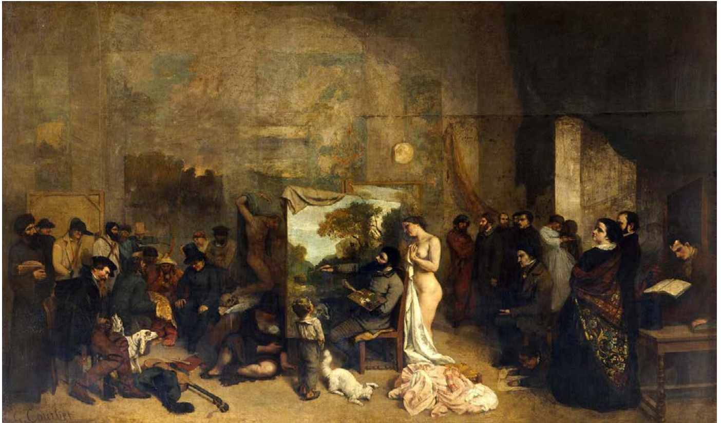
Gustave Courbet, El taller del pintor. Alegoría real, determinante de una fase de siete años de mi vida artística y moral (1855).

con el resto de la sociedad» (2004: 305) 3 . Sin embargo, ¿acaso sigue siendo factible tales concepciones del arte, cuando ni siquiera los conceptos de moralidad o revolución social están claros en un mundo como el actual? ¿Qué rasgos caracterizarían a un supuesto orden global