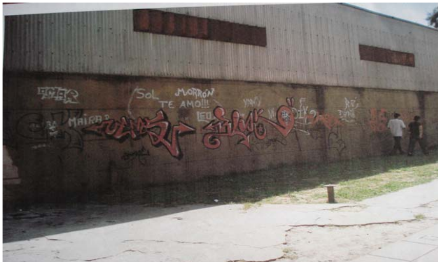
Fig. 1. Muro exterior del establecimiento escolar.

particulares. Este marcar los bancos, acción observable no sólo en esta escuela, me llamó la atención. En las paredes externas de la escuela también observé grafitis, algunos de ellos trabajados con cierta destreza técnica.