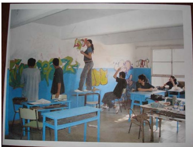
Fig. 2. Producción en la clase de Plástica Visual (2006).

Desde las expectativas del área, el proyecto integró temas del Lenguaje Plástico Visual, y se pudo abrir la discusión sobre las expresiones estéticas y los espacios públicos. En este sentido, se creó un espacio de reflexión propicio para discutir sobre la legitimidad de hacer grafitis en el aula, solicitar permisos, o debatir sobre el uso de paredones de propiedad privada y la cuestión de estampar grafitis “sin permiso”; todo esto puso a circular opiniones no siempre negociables. El ejercicio de discutir y tratar de argumentar fue una experiencia abierta a partir del proyecto.