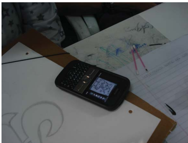
Fig. 3. El celular como archivo de imágenes.

Una de las propuestas que amplió la unidad de los grafitis fue pedirles a los alumnos que registraran con sus celulares imágenes de grafitis que observaran, por ejemplo, durante el recorrido para llegar al colegio (Fig. 3). La propuesta se llamó “grafitis recolectados en la calle” 7 . Aunque muy pocos se interesaron en la propuesta, aún así se pudo trabajar desde material bajado de Internet el origen de las manifestaciones grafiteras. Videos del Mayo Francés entre otros 8 permitieron discutir acerca del origen y la visibilidad de los artistas grafiteros (en su condición de artistas a veces definidos como vandálicos), la expresión de otros estudiantes, la ciudad y sus espacios como soporte de visualidades. Estas discusiones permitieron poner en circulación conceptos del campo artístico y de los discursos visuales en los espacios públicos. En este sentido fueron momentos de observación e interpretación de imágenes que habilitaron conexiones entre distintos contextos históricos, imágenes, discursos e imaginarios sociales. Esas imágenes ampliaron la observación y la primera mirada de expresión “vandálica” en relación a los grafitis. En este sentido llevar material audiovisual fue indispensable aunque hubo que sortear algunos inconvenientes institucionales. 9