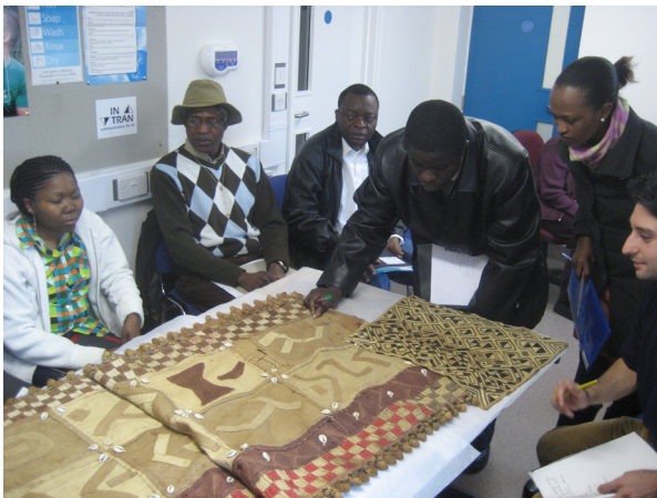
Fig. 2. Cultura y Lengua inglesa , 2010-2011: ejemplo de talleres.