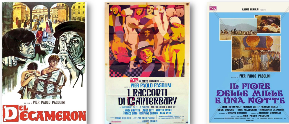
Figura. 2. Carteles de las películas “El Decamerón”, “Los cuentos de Canterbury” y “Las mil y una noches” [Grimaldi (productor) y Pasolini (director) (1971, 1972 y 1974)].