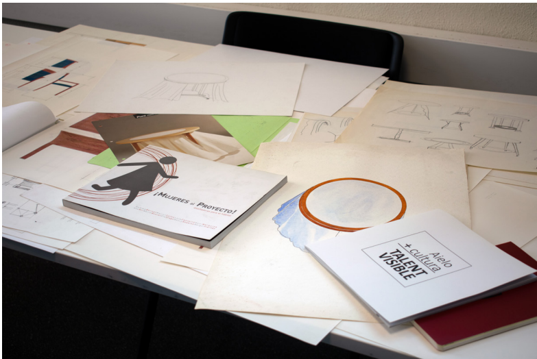
← Fig. 1: Bocetos, trabajos y publicaciones, fondos AVD en relación a Lola Castelló, Facultad de Geografía e Historia, UV, Valencia.

más innovadora y eficaz (Sandoval-Aliste, 2014). Sin embargo, ni diseños ni diseñadores son diversos en la actualidad. Pese a poder considerarse una disciplina joven (Fragoso, 2008) los diseñadores son en general modelos masculinos cisgénero enfocando generalmente sus diseños desde esta perspectiva. De igual forma lo han sido en la Historia del Diseño, no valorando la actuación de mujeres que aportaron méritos a productos, espacios o procesos. En algunos casos sin visibilidad alguna, en los mejores a la sombra de un diseñador