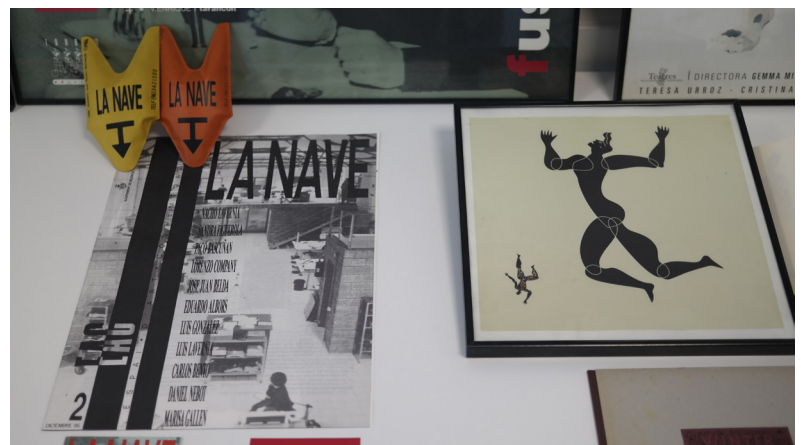
→ Fig. 2: Bocetos, trabajos y publicaciones, fondos AVD en relación a Espacio Paco Bascañán, Facultad de Geografía e Historia, UV, Valencia.

Investigar el pasado a través del presente resulta un instrumento útil ya que satisface varias finalidades. Por un lado, la conexión con la realidad intangible que vivimos a través de la energía transformadora del que vive y ama su profesión. Esta, sin duda, es la razón más poderosa para testimoniar los verdaderos roles y conseguir nuestro objetivo principal, activar en la juventud opciones de desarrollo profesional. Por otro lado, hacer una lectura en contra dirección con testimonios vivos permite acometer en línea recta los puntos de interés. Finalmente, generar material para difundir ha sido el último eslabón. Por tanto, nuestro trabajo en cadena en tres fases consecutivas es: identificar, planificar y difundir.