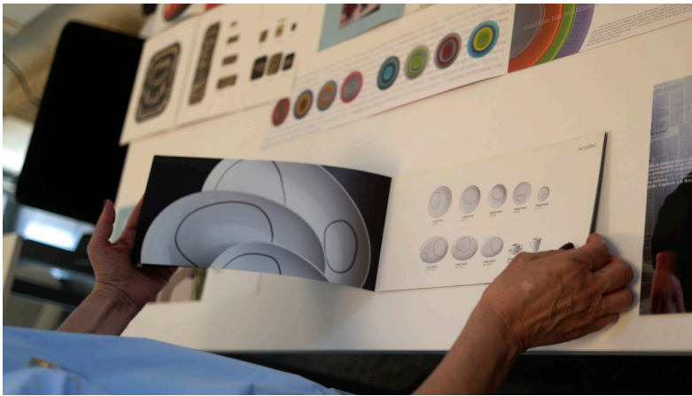
← Fig. 3: Bocetos, trabajos y publicaciones, fondos AVD en relación a La Mediterránea, Facultad de Geografía e Historia, UV, Valencia. Fotografía: Grupo Midi, 2022.

La dificultad estratégica es la creación de conciencia de grupo del estudiantado: es preciso una motivación y trabajo previos que los involucren. Como los resultados no son inmediatos, esta fase es donde más ampliamente se diferencia la investigación a un trabajo habitual. Han de llegar a asumir que el trabajo es por y para ellas y ellos. Para conseguirlo se enmarca, especialmente, el dato de que la aproximación de diseñadoras y diseño con la posición de estudiante será efectiva y se verá y difundirá en formatos fotográficos y audiovisuales.