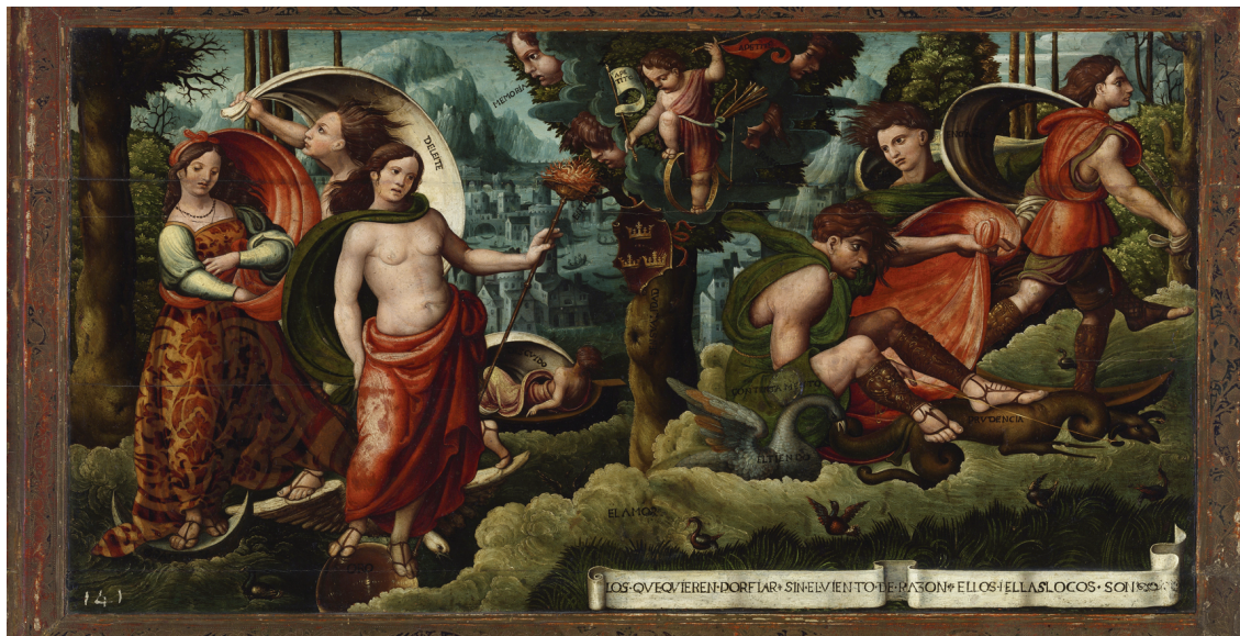
Fig. 4. Maestro de Alcira, Alegoría (del matrimonio) , óleo sobre tabla. Szépmvészeti Múzeum / Museo de Bellas Artes de Budapest.