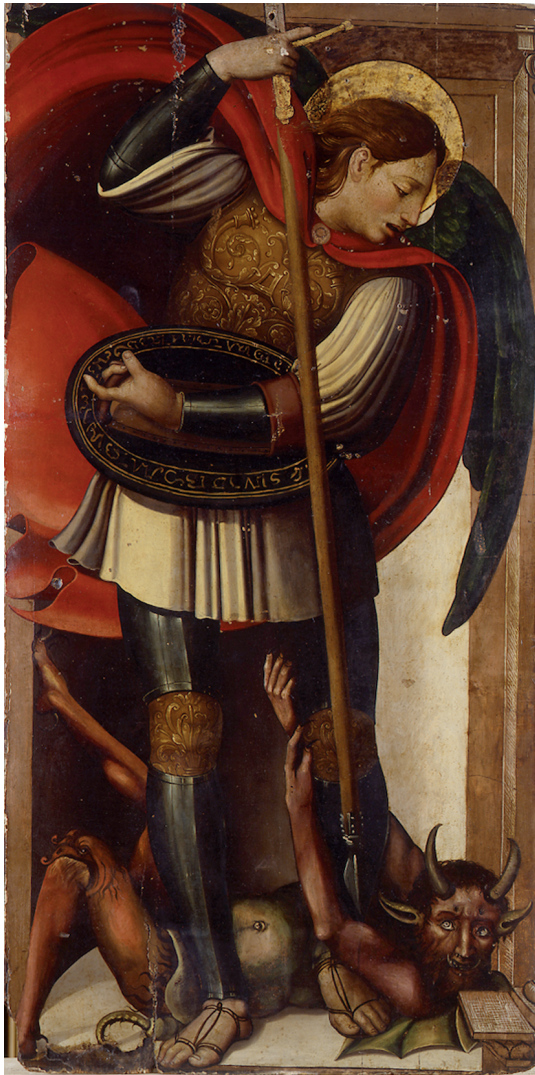
Fig. 2. Maestro de Alcira, Arcángel San Miguel , tabla. Museo de Bellas Artes de Valencia.