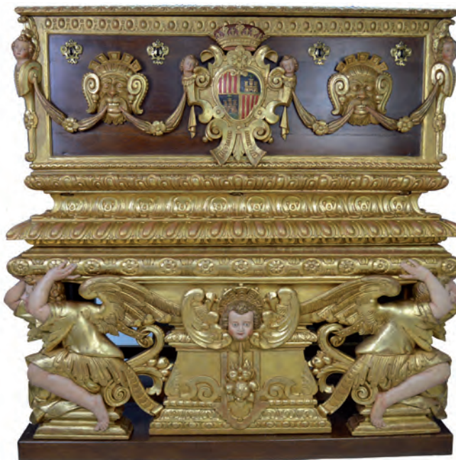
Fig. 1. Arca de les insaculacions de Cort.

cossos. Les seves dimensions (163 x 173 x 69 cm), la talla i el daurat que presenta contribueixen a dotar-la d'una importància inusual. El cos inferior compta amb tres cares tallades, mentre la quarta permet veure l'estructura que suporta tota la peça. La frontal està protagonitzada per una peanya trapezoïdal decorada amb fulles d'acant, motius auriculars i motlures que culminen en un cap alat de querubí del qual penja un pom de fruites. El flanquegen dos suports antropomorfs en forma d'àngels-atlants agenollats. Sustenten una desenvolupada base sobre la que recau el cos superior, rematada amb motlures. Les cares laterals repeteixen el motiu de la peanya culminada pel cap d'àngel, flanquejada per volutes i elements vegetals. Tot el cos inferior està acabat combinant daurats i policromia.