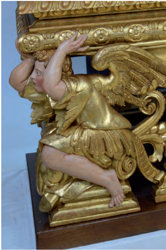
Fig. 2. Detall d'un àngel-atlant del cos inferior.

ferior i la connectà amb l'estil de l'escultor Gabriel Torres, autor de la volada de Cort. 15 En la dècada dels noranta Mercè Gambús insistí en el tractament manierista de la peça. 16