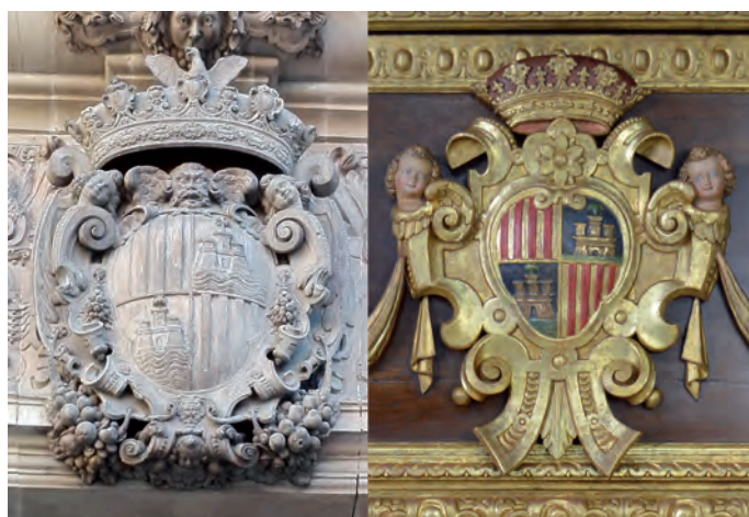
Fig. 3. Escut de la façana de Cort i de l'arca.

A tot això avui afegim l'arca de les insaculacions de la Universitat. El preu estipulat en dues-centes lliures pel treball de la fusta reflecteix suficientment la seva importància. Cal comparar aquesta