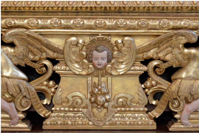
Fig. 5. Elements propis dels Oms en la peanya del cos inferior.

assoleixen els elements tallats en forma de fullatges i penjants, i les mènsules laterals evidencien la seva evolució siscentista. Aquelles vuit peces que corresponen als "capitells" adquirits a Jeroni Oms, foren dibuixades per Ferrà en forma de caps de querubins amb ales sobre decoracions auriculars o en forma de màscares sobre motllures vegetals (Fig. 5). Repeteixen tant la iconografia com els motius decoratius de l'arca que aixoplugaren. En definitiva, el 1669 els jurats aconseguiren complir la seva intenció de posar l'arca "en major forma, en part y aposito particular". 60