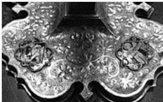
Fig. 2. Peana.