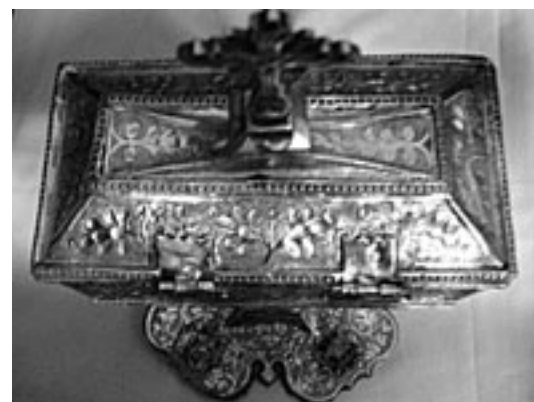
Fig. 8. Tapa.