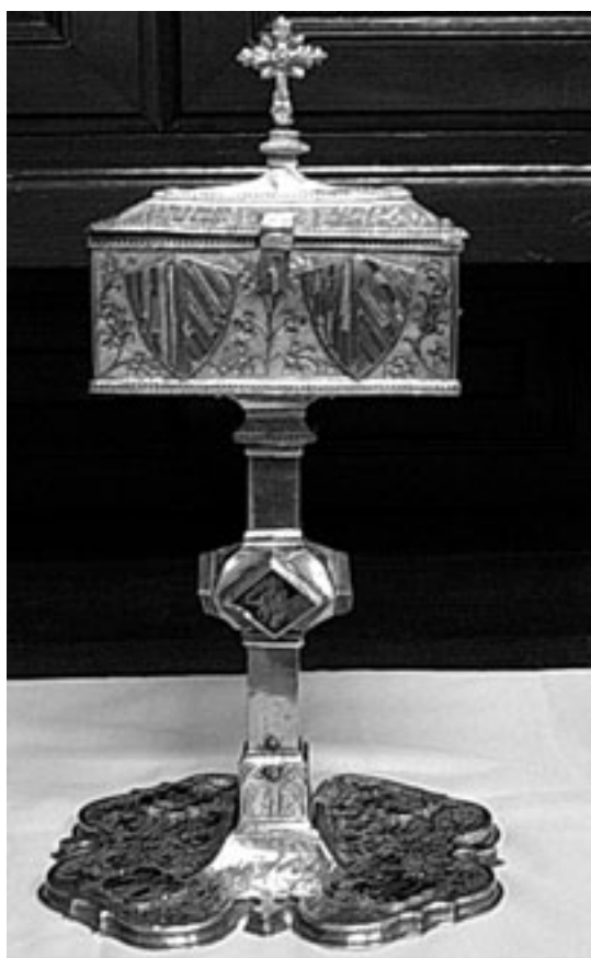
Fig. 1. Arqueta de Alboraya.

La pieza responde a las características propias de su tipología del gótico final. 5 Se trata de una arqueta eucarística, realizada en plata sobredorada. 6 La peana plana, de perímetro ondulado mixtilíneo, con entrantes pronunciados en forma de punta de lanza, exhibe pestaña llana y cenefa