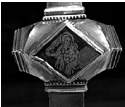
Fig. 5. Nudo.