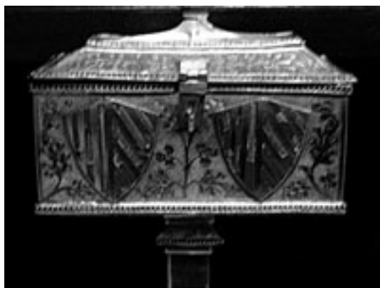
Fig. 6. Anverso de la arqueta.