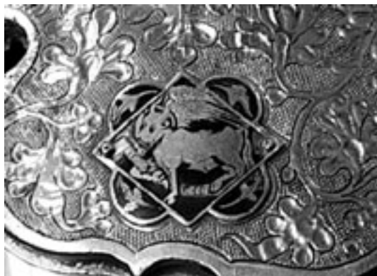
Fig. 3. Esmalte.