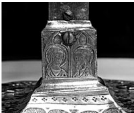
Fig. 4. Base del astil.