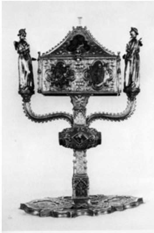
Fig. 12-13. Copón ostensorio de la Catedral de Tortosa. Copón ostensorio atribuido al Papa Benedicto XIII, el Papa Luna, datado hacia 1380-90.

Así mismo, la localización de un inventario de bienes de la iglesia de Alboraya, realizado en mayo de 1406, 11 permite corroborar su existencia en la segunda mitad del siglo XIV. El documento, redactado ante el notario Jaume Monfort, ofrece datos significativos para su correcta identificación. De este modo, se cita una custodia , nombre con el que en esta época designaban al recipiente destinado a guardar las formas eucarísticas. Se la describe con una pequeña cruz de remate de plata blanca, peana con las representaciones de los Evangelistas en esmaltes, dos escudos de la familia della Volta, y cuatro imágenes de la Virgen María en el nudo: una custodia ab una creueta dargent blanca ab los evangelistes al peu e sengles smalts ab II senyals de la Volta e en mig del peu IIII images de la Verge Maria .