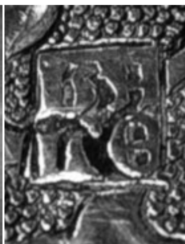
Fig. 11. Marca de Valencia.

con vestido en verde, los cabellos rubios, mientras que en las alas del Arcángel quedan rastros de amarillo y rosa. En los laterales, figuran medallones con las representaciones del Padre Eterno y Jesucristo, cuyos esmaltes de variado colorido: azul, verde, amarillo y rojo, responden a la influencia italiana asumida por la esmaltería mediterránea de los siglos XIV y XV 7 (figs. 6-7).