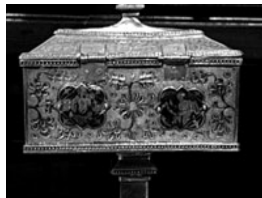
Fig. 7. Reverso de la arqueta.