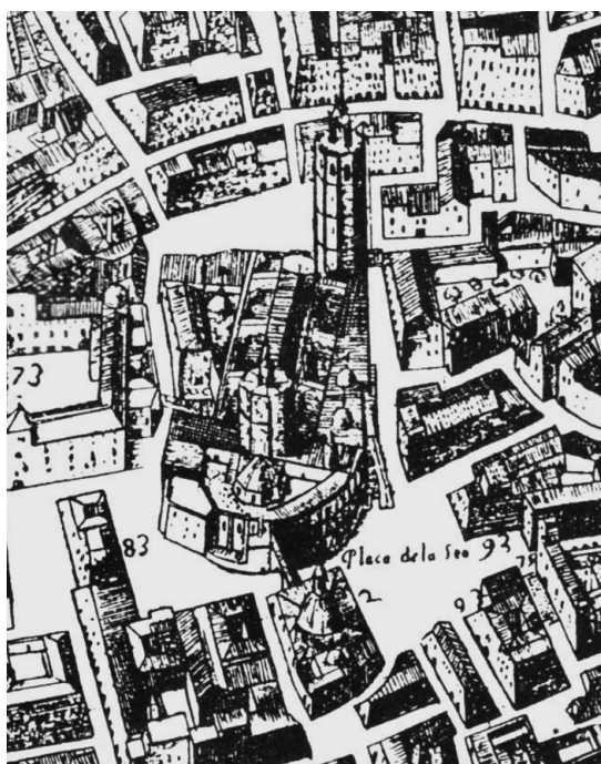
4. Imagen de la catedral de Valencia, dibujada por Tosca.

la escultura que se encontraba en el interior. Por este retablo el maestro Carles iba a cobrar la suma de 2900 sueldos que se irían pagando durante seis años.