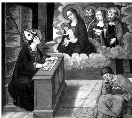
3. Aparición de la Virgen a San Martín en su celda, Nicolás Falcó, catedral de Valencia.

En principio, se añade a la figura principal del San Martín a caballo con el pobre, cuatro historias de