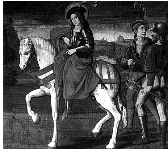
2. San Martín partiendo su capa con un mendigo, Nicolás Falc6, catedral de Valencia.

un proceso tímido, lento, que parece tener su auge en la transición al siglo XVI y luego detenerse, pero que explica la existencia de talleres en Valencia como el de los Forment, que si no, no hubieran podido comprenderse. La problemática de todas estas obras, es como podemos imaginar, su casi completa desaparición. Apenas nos han quedado ejemplos de este tipo de soluciones retablisticas y los únicos que quedan son casos aislados que no nos permiten comprender cabalmente este proceso. Quizá el más significativo sea el retablo de la Puridad, obra del taller de los Forment, en el que a pesar de que hay una importante presencia de obra pictórica, hay también un significativo protagonismo escultórico.