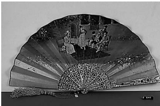
Abanico con varillaje de nácar y país de raso de seda representando escena costumbrista de baile. Taller valenciano. Estilo alfonsino. 1880. N° inv. 2-641. Museo Nacional de Cerámica y Artes Suntuarias González Martí (Ministerio de Cultura).