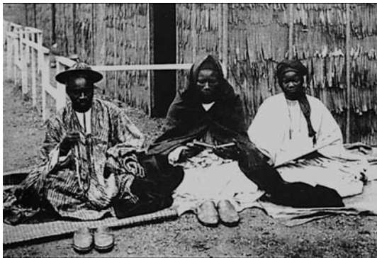
Exposición Etnográfica en el Buen Retiro. Madrid. 1897.

En el siglo XVIII, con Carlos III, impulsor de los mu-