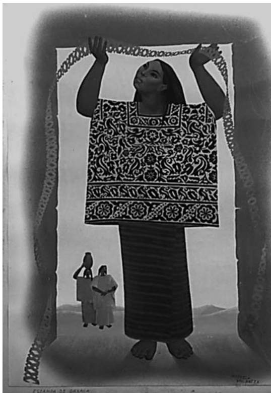
Acuarela de Manuela Ballester. Museo Nacional de Cerámica y Artes Suntuarias González Martí. Valencia (Ministerio de Cultura). Sin nº. Inv.

museos de titularidad Estatal y del Sistema Español de Museos, los museos adscritos al Ministerio de Cultura deben llevar varios registros: de la colección estable del Museo, de depósitos de fondos pertenecientes a la Administración del Estado y a sus Organismos autónomos y de otros depósitos (art. 11.º Inscripción de fondos)