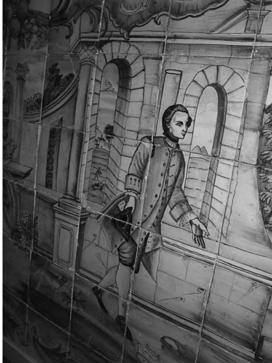
Casaca que viste un personaje representado en el panel cerámico. Museo Nacional de Cerámica y Artes Suntuarias González Martí. Siglo XVIII.