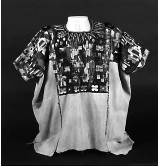
Huipil bordado por los mayas.

En España, en 1881, Antonio Machado y Álvarez fundó la Sociedad de Folklore Español cuyo objetivo era la recolección y el estudio de romances, canciones y materiales literarios. El etnógrafo Luis de Hoyos impulsó la creación del museo del Pueblo Español, en cuyo decreto fundacional se condensaba su filosofía: