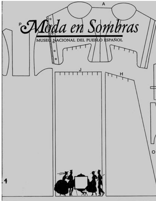
Portada del catálogo de la Exposición Moda en Sombras . Madrid. 1991.

solicitud real de Carlos III. Inició así el inventario, que sería la base del posterior catálogo. El museo se presentó por secciones: