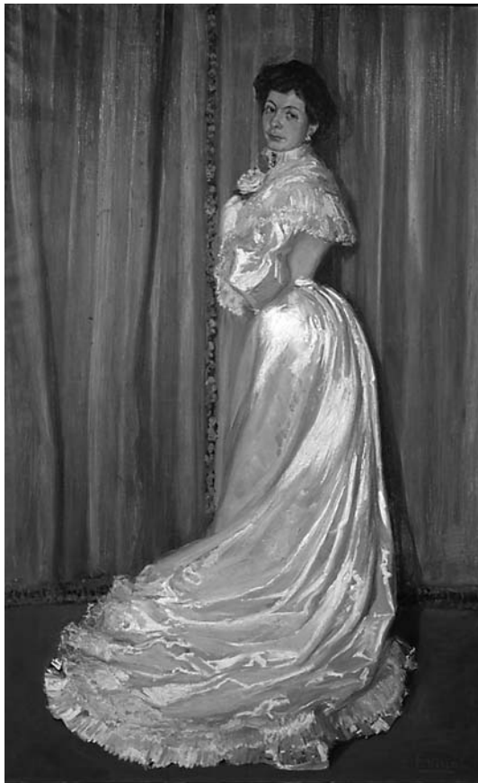
Óleo sobre lienzo de Mujer con vestido encolado . Pinazo. Museo Nacional de Cerámica y Artes Suntuarias González Martí. Siglo XIX.

Cuando a un objeto se le da de baja en el museo a causa de un robo, rotura o desaparición, se añade al libro de registro una nota explicando el tipo de baja y la persona que autoriza la baja.