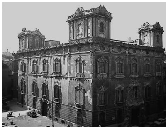
Fachada del Museo Nacional de Cerámica y Artes Suntuarias González Martí de Valencia (Ministerio de Cultura).

d) Conjunto funerario de las Huelgas, con una espectacular e inigualable colección de tejidos y trajes de la Edad Media procedentes de ajuares fune-