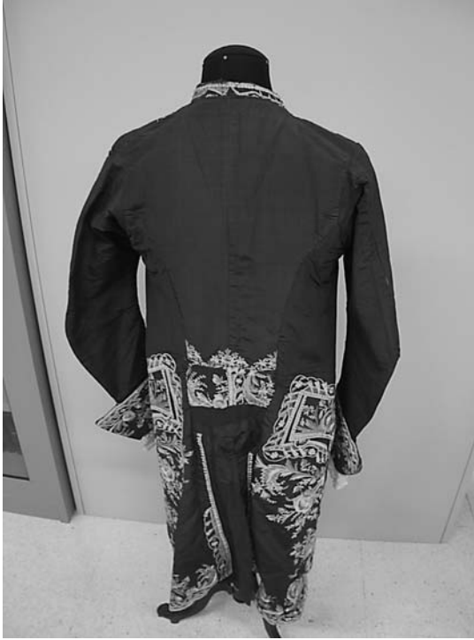
Casaca de espalda de seda azul con ligamento tafetán, bordada a flores. Museo Nacional de Cerámica y Artes Suntuarias González Martí. Valencia (Ministerio de Cultura). N° inv. 2-135.