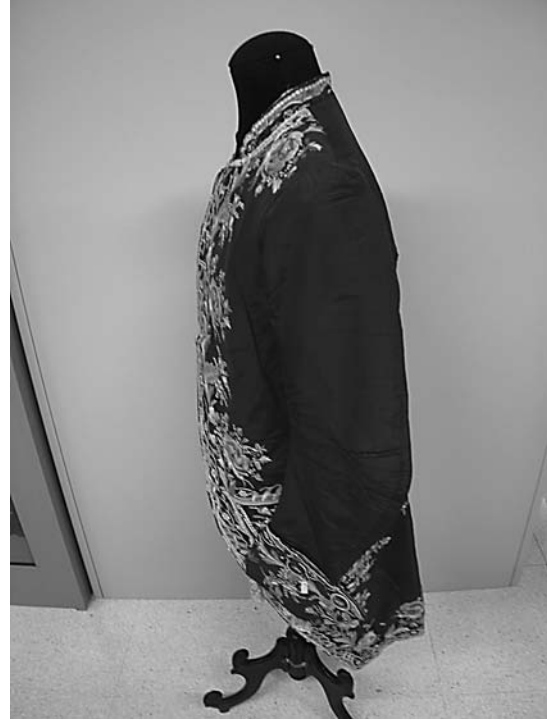
Casaca de perfil de seda azul con ligamento tafetán, bordada a flores. Museo Nacional de Cerámica y Artes Suntuarias González Martí. Valencia (Ministerio de Cultura). N° inv. 2-135.

c) Nombre común del objeto. Es el nombre actual en la lengua propia del país. El objetivo es obtener una lista actual de palabras a partir del nombre de los objetos (nomenclátor) y constituir con el tiempo un léxico, método de almacenar y recuperar la lista. Por ejemplo. Sarape, que es el nombre propio de la prenda en Méjico o saragüells , nombre valenciano para designar a los calzones conocidos en castellano como zaragüelles. Ahora bien, si el museo es estatal y establece como criterio general la inscripción del nombre en castellano, debe respetarse el criterio del museo, como es el caso del Museo Nacional de Cerámica González Martí, donde se da a las prendas el nombre en castellano y en el caso de prendas etnográficas mejicanas, se respeta el nombre mejicano por ser el de uso más general.