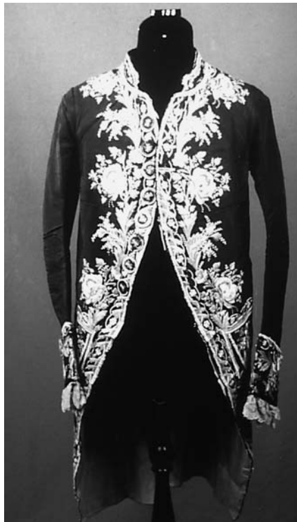
Casaca delantera de seda azul con ligamento tafetán, bordada a flores. Museo Nacional de Cerámica y Artes Suntuarias González Martí. Valencia (Ministerio de Cultura). N° inv. 2-135.

Además de los Registros señalados anteriormente, todos los Museos de Titularidad Estatal deben elab-