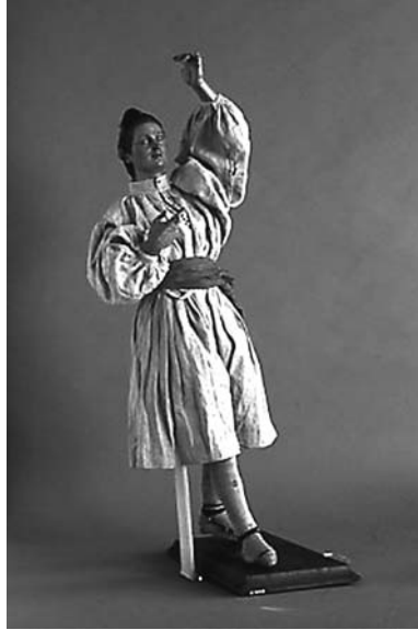
Figura de belén ataviada con camisa y saragüells de lienzo beige. N° inv. 18068.