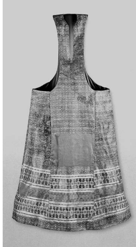
Pellote de seda e hilos entorchados de oro y plata que perteneció a Leonor de Castilla, reina de Aragón. Monasterio de Santa María la Real de Huelgas. Burgos. N° Inv. 00650514.

de Canadá y EEUU. Consta de trajes y piezas de adorno de diversas culturas americanas, como las de la costa Noroeste (camisas impermeables para la pesca hechas con membrana de pescado), los indios de las praderas (piezas de uso personal: tocados, camisas, mocasines, ligas, objetos que han podido formar parte de la colección de Pedro Franco Dávila reunida en París de uso femenino, como enredos o echarpes, huipiles o blusas, cortes o paños para la cintura, tzutes o telas para tocados o adornos de hombros; de uso masculino, que incluye pantalones, fajas, sacos o chaquetas, camisas). De Guatemala proceden máscaras policromas de madera con formas de rostros humanos o animalísticos. De la Amazonía peruana hay collares, sombreros de plumas, kachinas o muñecas amuleto. De América Central se custodian vestidos del siglo XX, como los de los indios huicholes del norte de Méjico y de Guatemala, o los huipiles , camisas femeninas bordadas por los tejedores mayas de Chichicastenango. 8 Son similares a las custodiadas en el Museo Nacional de Cerámica y Artes Suntuarias González Martí de Valencia.