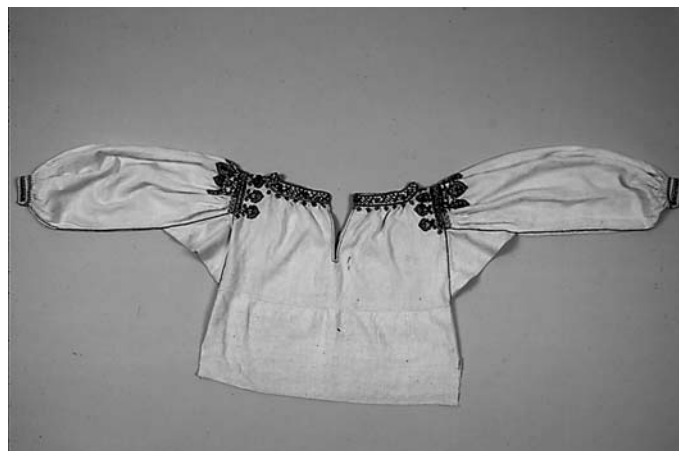
Camisa de hilo. Museo Nacional de Cerámica y Artes Suntuarias González Martí (Ministerio de Cultura). Nº 2-898.

Inmediatamente a la entrada de una prenda en el museo, en el departamento de Conservación se