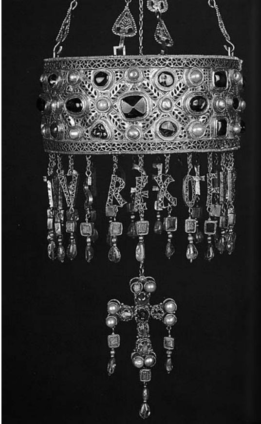
Corona de oro de Recesvinto. Museo Arqueológico Nacional.

Los siglos XIX y XX vivieron la eclosión de los museos y las más variadas tipologías. Empezó con los museos arqueológicos y siguió con los de Bellas Artes, de Arte Contemporáneo, de Artes Decorativas, ciudades-museos, museos al aire libre, museos jardines, parques naturales, ecomuseos, museos de Historia, museos Militares, museos de Etnografía, Antropología y Artes populares, museos de Ciencias Naturales, museos Científicos y de Técnica Industrial. En general, el concepto actual de museo queda patente en numerosos espacios culturales, los cuales hacen un gran esfuerzo por ponerse al día en los planteamientos más esenciales, esto es, en su filosofía, como es el caso del Museo Nacional de Cerámica y Artes Suntuarias González Martí de Valencia, que se rige por la legislación estatal de Museos Nacionales. El museo se convierte en una institución de carácter permanente que adquiere, conserva, investiga, comunica y exhibe, para fines de estudio, educación y contemplación, conjuntos y colecciones de valor histórico, artísti-