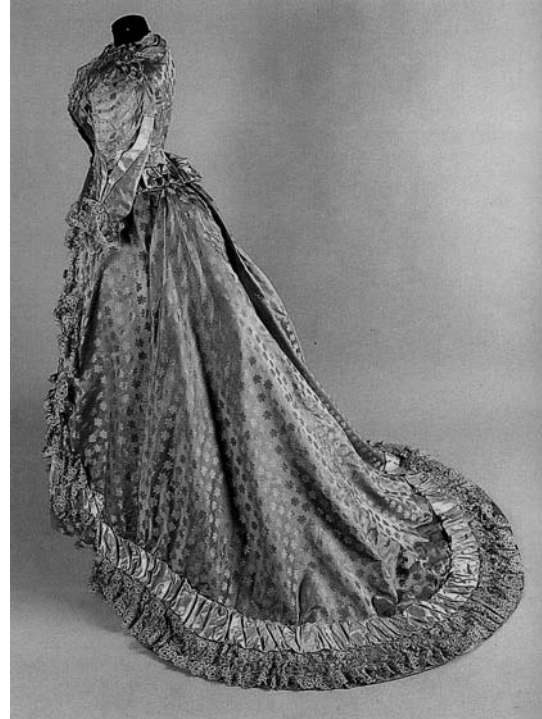
Vestido de seda encolado y bordado en color oro miel.

los faldones y los bolsillos con hilo de seda de colores: verde, marrón, salmón, beige, azul, formando motivos florales y cenefas de lunares beige. Se abrocha por delante con hilera de ocho botones forrados de seda y bordados con hilo de seda beige y marrón representando dibujo estrellado. Pequeño cuello levantado. Mangas cortadas con la forma curvada con vueltas bordadas a flores y decoradas con un par de botones semejantes a los del delantero y se rematan en una pieza de encaje de tul con flores. Está confeccionada con costuras en las mangas arriba y abajo, en la espalda en número de tres, una central que desciende desde el centro hasta abajo, donde coincide con una abertura y dos laterales que van desde la sisa hasta abajo. En los faldones se incorporan pequeñas piezas cosidas al cuerpo general dispuestas de distinto modo, aprovechando restos de tejido azul. Forro interior de seda beige en cuerpo y algodón en mangas y centro de la espalda.