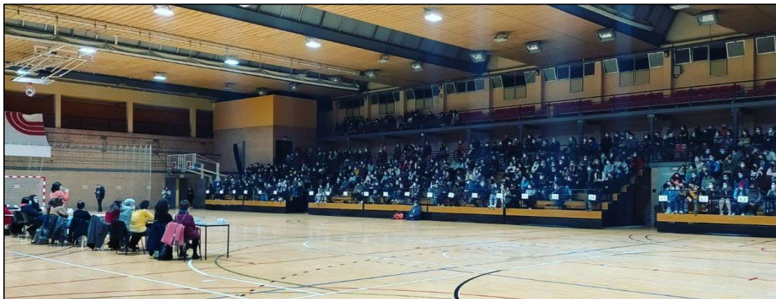
Figura 1. Fotografía de la noche del censo (15 de diciembre de 2021)

diagnóstico de su realidad y aportando a través de sus historias y relatos de vida (Botija y Matamala, 2022).