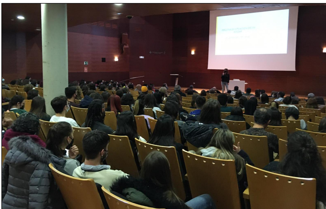
Figura 4. Fotografía de las sesiones de formación en materia de sinhogarismo

El hecho de haber empleado la metodología de la Investigación-Acción Participativa ha reportado otros beneficios para la investigación. Entre ellos la sensibilización y formación sobre las realidades invisibilizadas del sinhogarismo a un gran número de personas voluntarias. Por otro lado, la construcción de la perspectiva crítica entre el alumnado universitario, quienes se han querido sumar al proyecto y sumergirse en el trabajo de campo, la investigación y la acción social.