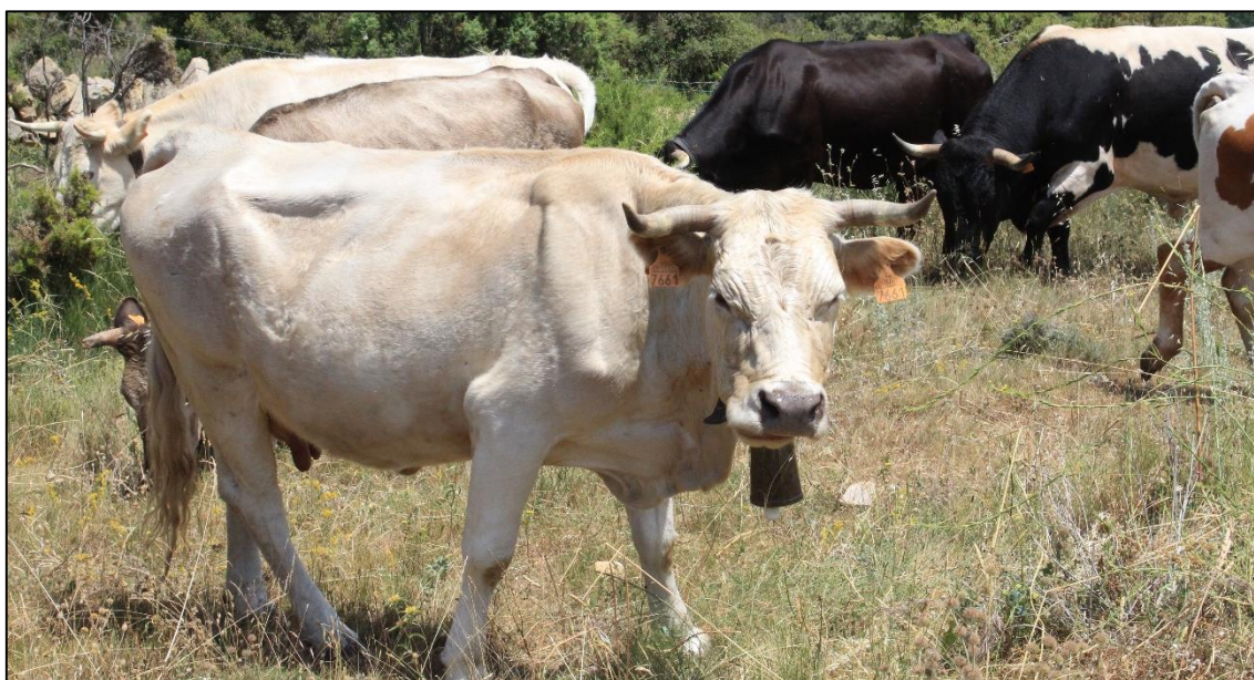
Figura 3. Ejemplo de especies de ganado destinatario del alperujo