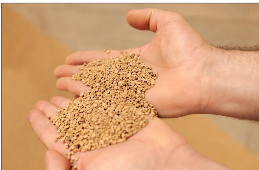
Figura 2. Alperujo listo para su consumo por parte del ganado

Esta solución, al ser mucho más económica y adecuada que la utilización directa de piensos compuestos, podría llevar a la amortización de la inversión (silos y carros mezcladores de gestión individual o colectiva), y al mantenimiento de los costes de producción de sistemas de conservación y almacenaje de alimentos, y contribuiría a la adecuada gestión de los subproductos agroindustriales de la Comunidad Valenciana.