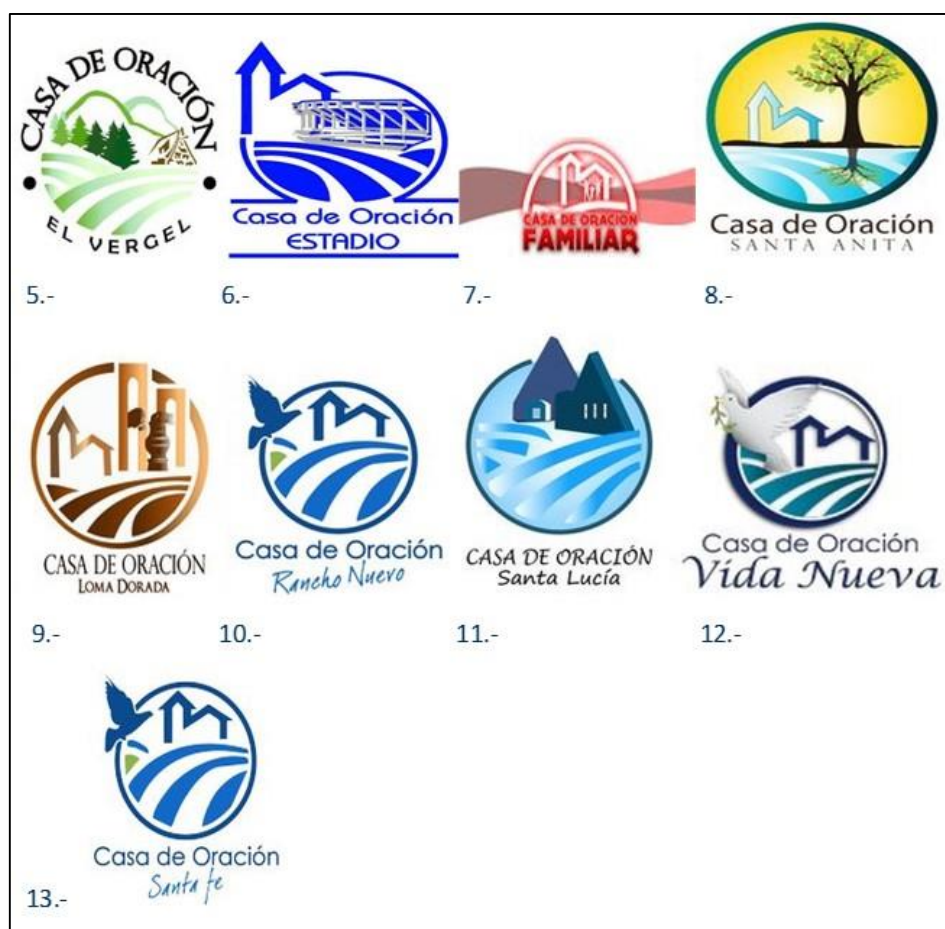
Figura 2. Iconos de los templos de la Iglesia Casa de Oración