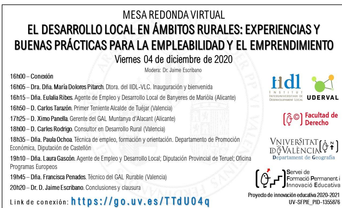
Figura 1. Organización y ponentes de la mesa redonda

le ha funcionado, la participación proactiva y directa sobre/con la población local, y el acceso a establecer sus costumbres, hábitos y rutinas como una manera más de conocer el territorio. Ella señaló la trascendencia de realizar esta labor de conocimiento de las estructuras sociales de la sociedad y ciudadanía, como punto de partida a la hora de poner en marcha proyectos sostenibles y resolutivos para el municipio. También nos insistió en la importancia de la participación ciudadana en las labores del ayuntamiento y en la función de puente que realiza el AEDL entre la ciudadanía y la corporación municipal, a la hora de implementar las políticas públicas pertinentes. Por último, nos destacó el papel de interacción que el AEDL mantiene con los cargos públicos, especialmente en los municipios pequeños, ya que esta labor participativa y cognitiva se hace todavía más importante para el correcto desarrollo de estos territorios.