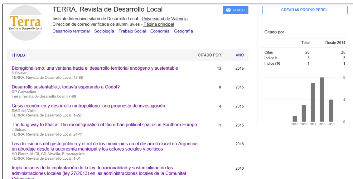
Figura 1. Métricas de TERRA en Google Académico (23 de julio de 2019)