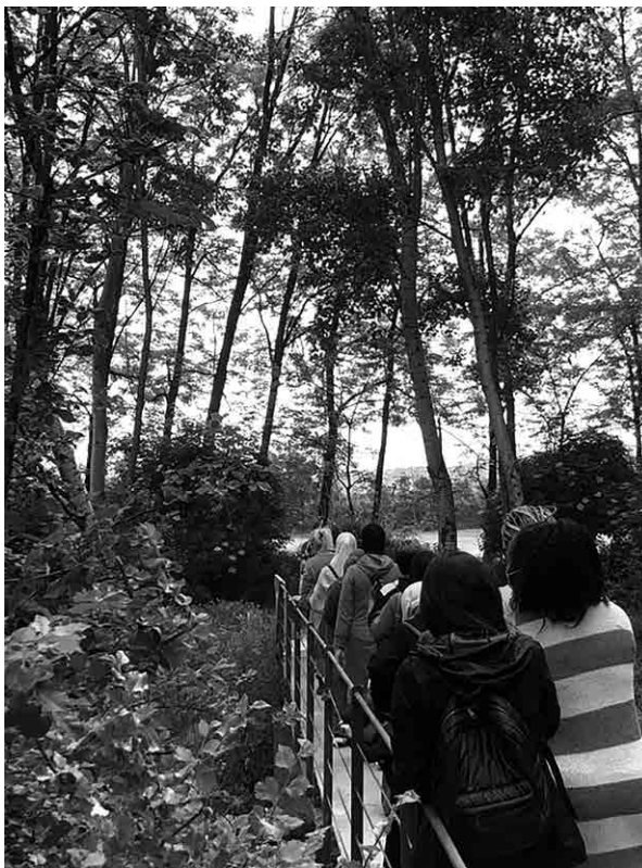
Imatge 2. Caminada dins les activitats del Mima't. Juny 2021.

Muerdo ft. Lola Membrillo (Perotá Chingó) – "Semillas" (2017). 4