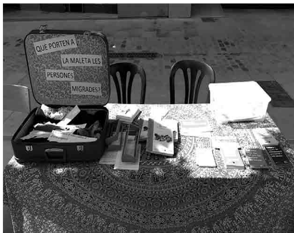
Imatge 1. Activitat comunitària de reflexió sobre el desplaçament forçat, portada a terme a les Festes del barri. Maig de 2021. La Maleta també és un blog http://la-maleta.org