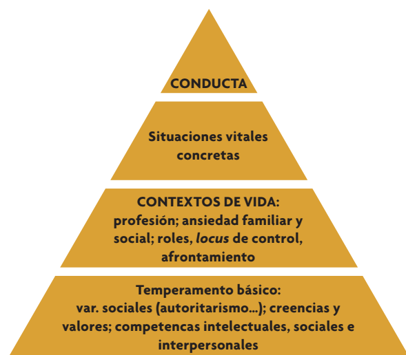
Figura 2. Estructura de la personalidad de los individuos.