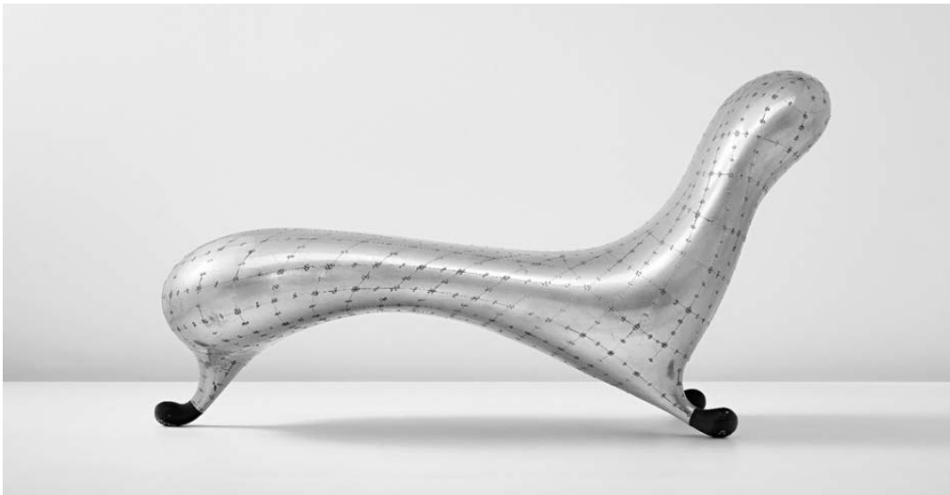
Fig. 2. Marc Newson: Lockheed Lounge , 1988

Las relaciones entre arte y diseño han sido, desde el principio, profundas e imbricadas; y, a menudo, como señala Camille Morineau, se han convertido en “un terreno minado que es preciso cruzar, pero tomando algunas precauciones”. 7 La separación de ambas disciplinas fue uno de los objetivos del Movimiento Moderno –del que la Bauhaus fue uno de los pilares fundamentales–, pero resulta un hecho significativo que la silla Wassily de Marcel Breuer formara parte de la exposición Machine Art que organizó el MoMA de Nueva York en 1932; y también es relevante que cuatro años más tarde