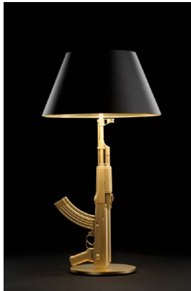
Fig. 4. Philippe Stark: lámpara sobremesa Gun , 2005

La reminiscencia de un pasado común y la permanencia en la actualidad de ciertos territorios creativos compartidos –como el design-art – han mantenido viva la polémica en torno a la supuesta naturaleza artística del diseño industrial. Por otro lado, la confluencia de dos factores distintos, como son la innegable dimensión estética de los objetos de diseño y la propensión general a subsumir lo estético dentro de lo artístico, han contribuido –tal vez de modo inconsciente, pero poderoso– a aumentar la confusión en esta controversia. 8 No obstante, y pese a todo, un objeto industrial no es per se una obra de arte; pues, por lo general, presenta una función utilitaria distinta al conjunto de predicados que se le han atribuido a la actividad artística. A la tradicional condición contemplativa de las obras de arte, que se hace patente en la prohibición “no tocar”, puede contraponerse la funcionalidad del objeto industrial que