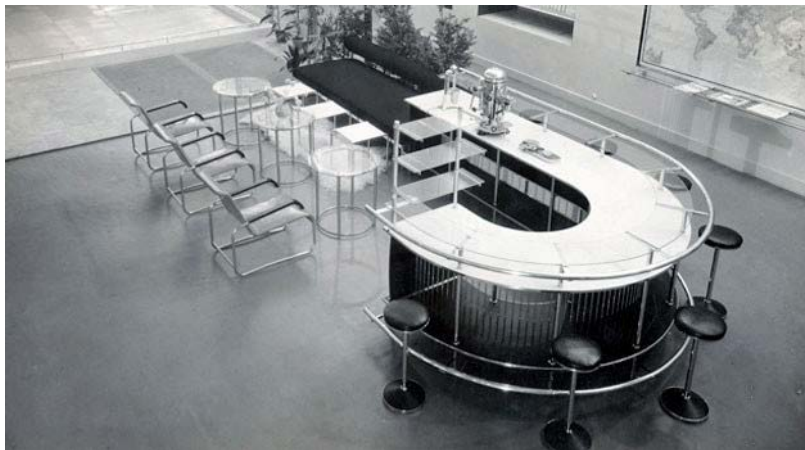
Fig. 1. Bauatelier Gropius con Marcel Breuer: prototipo de club social de una torre de viviendas. Exposición de la Deutscher Werkbund en París, 1930

Como vemos, la concepción industrial y productivista se impone. Si en el Manifiesto de 1919, Gropius instaba a los arquitectos, escultores, pintores a fusionarse con un nuevo artesanado, ahora son el obrero, el trabajador industrial y el ingeniero a quienes encomienda la construcción de las máquinas de habitar. Gropius se muestra en este texto implícitamente convencido de que la primacía de los nuevos procesos de producción fabriles es irreversible, por lo que resultaría contraproducente y, a la postre imposible, mantener una metodología artesanal. Pero, además, manifiesta abiertamente que “las exigencias espirituales de nuestros días”, los nuevos “modos de vida” de la sociedad moderna surgida de la revolución industrial, requieren nuevas formas para nuestros hábitats. Las formas abstractas de las máquinas (“los artefactos creados por el ingeniero”) sustituirán a la ornamentación figurativa de los “delineantes de adornos” (Fig. 1). En el fondo, la idea fundamental que subyace en todo el texto es que la belleza de los objetos industriales –que en términos baudelairianos recogería “lo transitorio, lo fugitivo, lo contingente” de los tiempos modernos– 5 tiene unas características diferentes a la belleza artística propia de las anteriores artes decorativas.