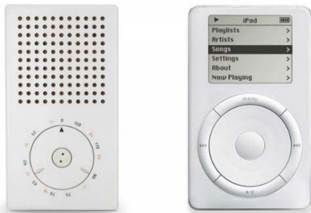
Fig. 7. Dieter Rams: radio Rams T3 , 1958 / Jonathan Ive, Ipod , 2001

La dimensión estética del diseño industrial es algo más extenso y profundo que la ornamentación de los objetos. Muchos creen que ella sólo opera en la superficie, pero en realidad conforma la esencia de los productos y condiciona la percepción que tenemos de su usabilidad. Donald A. Norman ha argumentado con detalle que “los