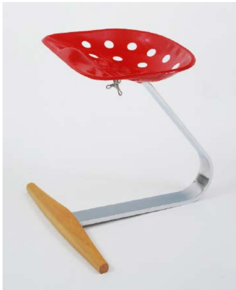
Fig. 3. Achille y Pier Giacomo Castiglioni: asiento Mezzadro , 1953

Por otro lado, la historia del diseño industrial ha documentado suficientemente cómo los cauces creativos del arte y del diseño industrial han confluído y se han retroalimentado desde hace más de un siglo. Sin duda, la técnica de los ready made de Marcel Duchamp inspira numerosas creaciones industriales –desde el asiento Mezzadro (Fig. 3) de los hermanos Castiglioni a la lámpara Gun (Fig. 4) de Philippe Stark– pero no es menor la influencia que el objeto industrial ejerció en los artistas del pop en los años sesenta. Por no hablar de la década de los ochenta, en la que las fronteras entre arte y diseño se difuminaron para muchos creadores de ambas disciplinas. Ciertamente, una vez pasada la ola postmoderna, las aguas volvieron a sus respectivos cauces, pero resulta evidente la permeabilidad de sus respectivos territorios en los que nunca han dejado de aflorar productos híbridos.