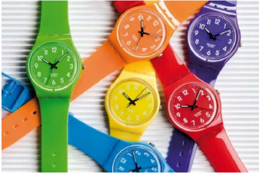
Fig. 8. Relojes Swatch, desde 1983

La importancia que ha adquirido la dimensión simbólica del producto en los últimos tiempos es uno de los factores que ha contribuido a alimentar el debate sobre si el diseño industrial es –o no– un agente activo de estetización difusa ; un proceso que, mediante el aderezo estético de la realidad, tendría como objetivo la estimulación del consumo y la sedación de las conciencias.