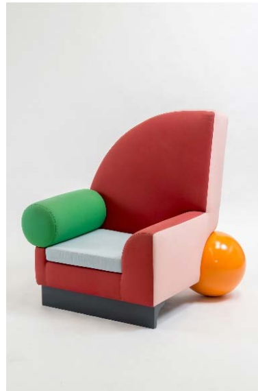
Fig. 6. Peter Shire: sillón Bel Air , 1982