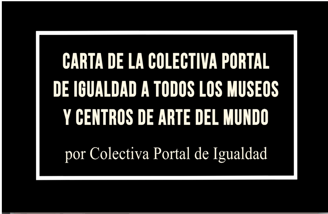
Figura 10. Carátula de la video-carta creada por la Colectiva Portal de Igualdad bajo la idea original de Mau Monleón Pradas, Manola Roig, Celeste Garrido y Amparo Zacarés Pamblanco. La dirección y el diseño artístico de la misma fue obra de Mau Monleón Pradas, Manola Roig y Amparo Zacarés Pamblanco. Edición final de Mau Monleón Pradas para la Acción número 20

todos los museos y centros de arte de España para invitarles a incluir un Portal de Igualdad en sus webs con motivo del Día Internacional de los Museos .