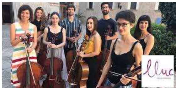
Lluç Celo Ensemble