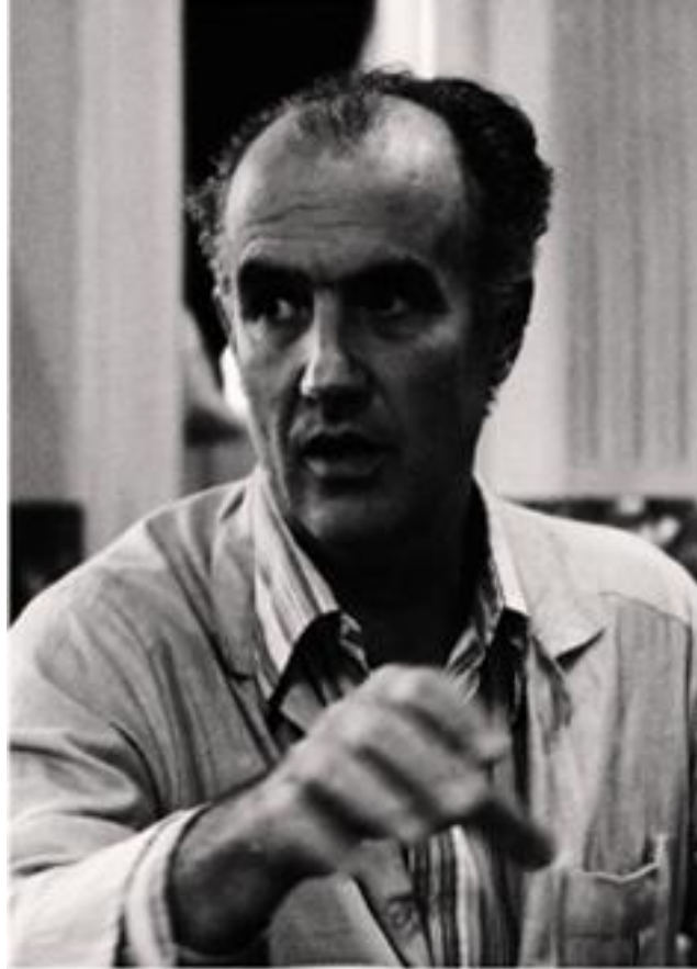
Le compositeur italien Luigi Nono

d'un engagement social et d'une démarche politique (depuis 1952, il est membre du Parti Communiste Italien). A bien tendre l'oreille, un des neuf mouvements d' Il Canto sospeso fait chanter en italien : « je meurs pour la justice [...] nos idées vaincront ».