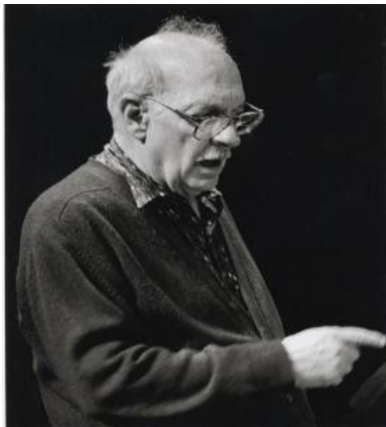
Le compositeur américain George Crumb