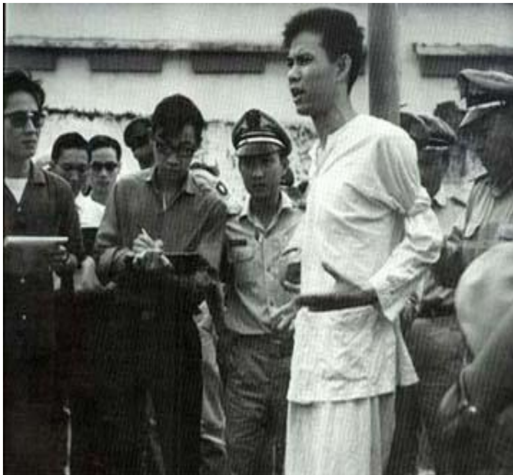
Le partisan sud-vietnamien Nguyen Van Troi