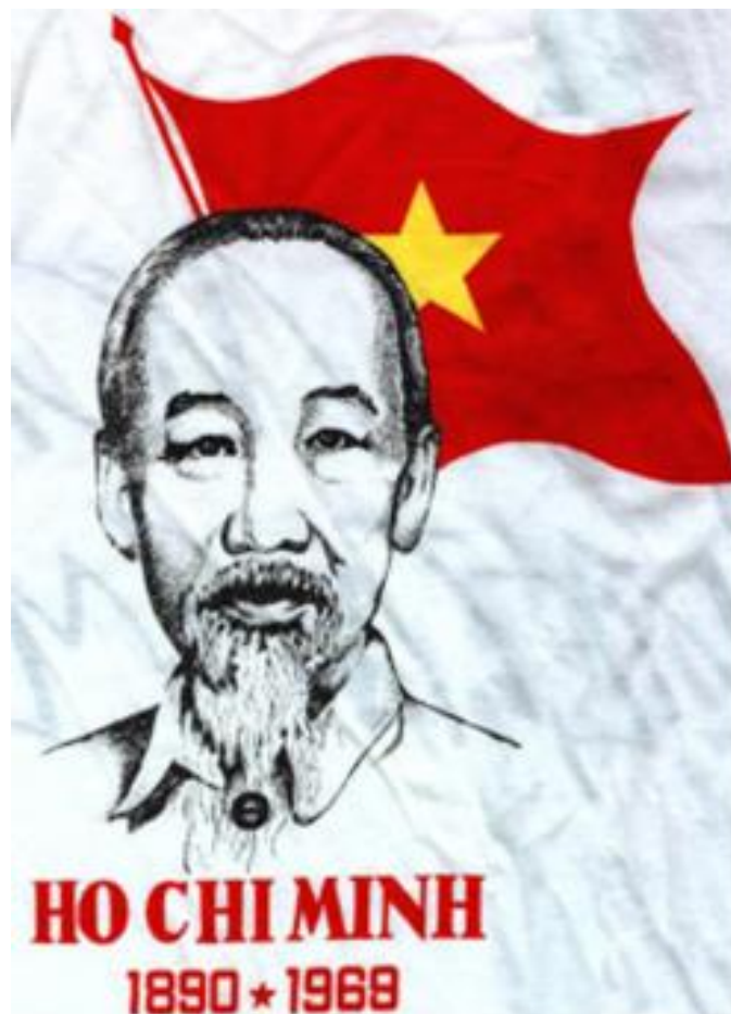
Drapeau politique représentant Hô Chi Minh