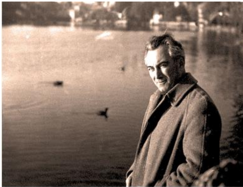
Le compositeur français Henri Tomasi

désenchanté des temps modernes, Henri Tomasi a ainsi répondu à l'appel de l'ailleurs. C'est dans l'horizon de cette altérité qu'il accède à une secrète intimité spirituelle.