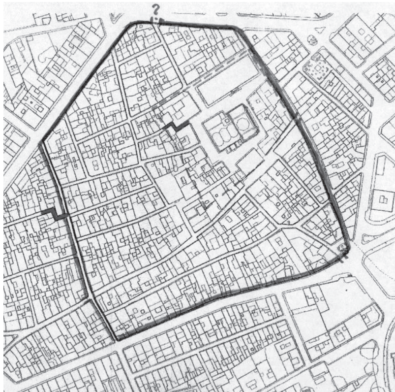
Fig. 3.- Plànol de Xàbia antiga amb la hipòtesi de dos recintes, un del segle XIII i l'altre dels XIV-XV (J. BOLUFER, 2004). S'han remarcat alguns recolzes significatius als carrers.

Encara que el poblament sempre suavitza els desnivells, queda clar que el nucli originari xabienc cercava la part més alta. No es pot descartar una fundació medieval de mitjan segle XIII (BOLUFER, 2004), però els documents són ja del XIV. L'any 1304, hi ha referències de la torre d'en Joan Cairat, la situació de la qual no és del tot segura. Espinós i Polo (1985) la col·loquen al NE del Mercat (carrer de les Roques, 5), identificant-la amb una torrassa del primitiu recinte, però Bolufer (2004) no s'hi avé en preferir una torre del convent de les Agustines (a l'altra part del carrer), alçat el 1662 al solar de l'actual mercat. 4 L'opinió de Vicent Boix (1865) i Roc Chabàs (1917) hi concorden. La torre en qüestió d'antuvi fou refusada pel rei Jaume II que en decretà la destrucció perquè hi veia un contrapoder a Dènia, però als pocs dies, la va autoritzar, el 16 de desembre. Fet i fet, estava ben acabada i calia dotar-la de defensors.