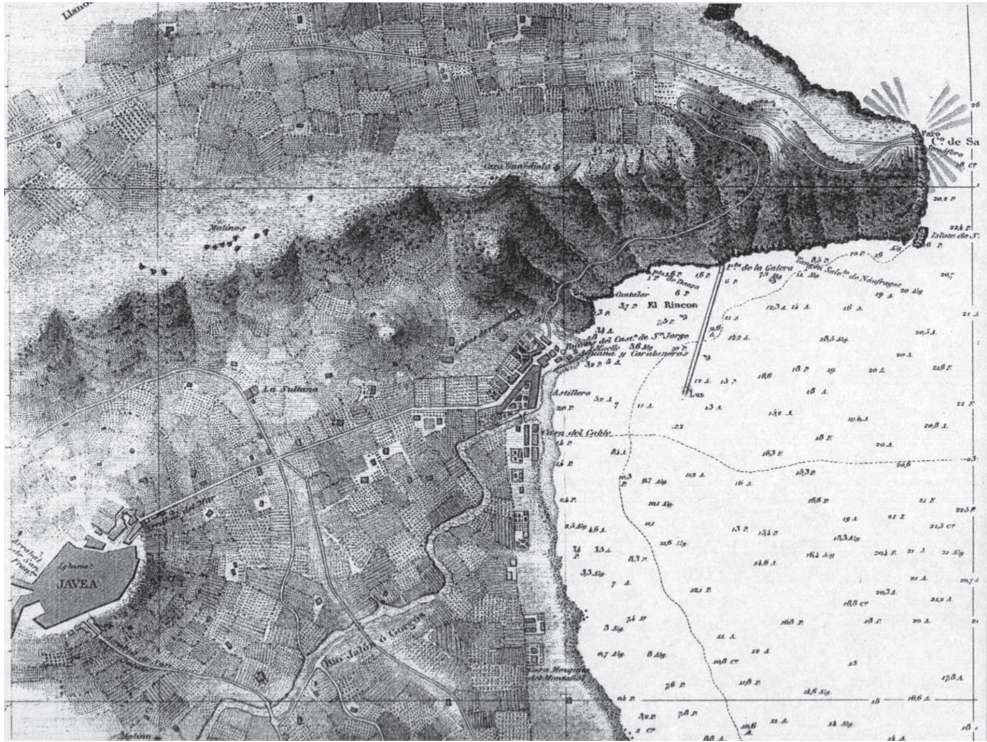
Fig. 2.- Detall de la vila de Xàbia i el port segons la carta marina de la Comisión Hidrográfica de 1879. El moll que arrenca de la punta de la Galera és posterior.

Durant uns quants segles, Xàbia no fou més que un “carrer de Dènia” i en certa manera ho seguiria essent fins a l’abolició de la senyoria, el 1805. La mateixa ratlla municipal trigaria molt a ser fixada per la controvèrsia amb la vall de Sant Bartomeu, a l’oest, camí de la Barranquera.