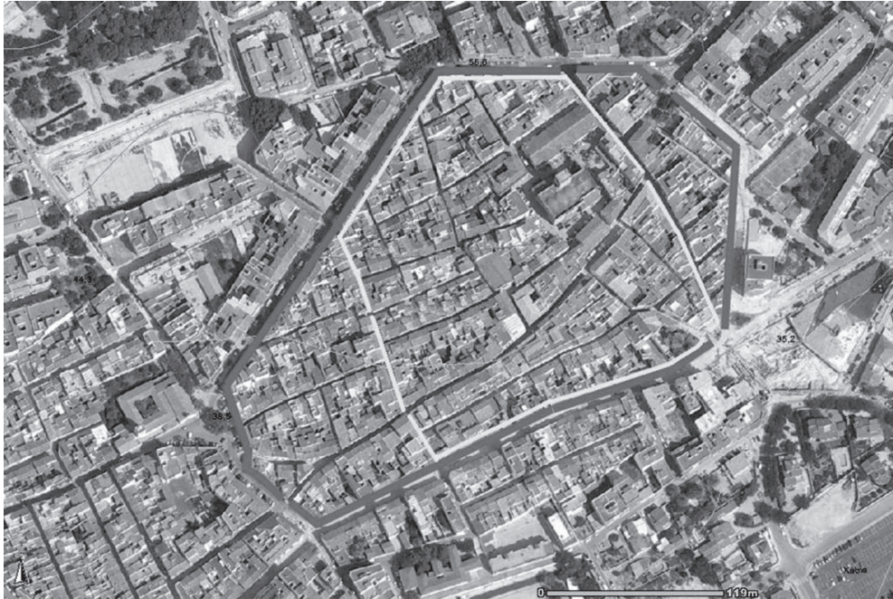
Fig. 4.- Ortofoto de la vila amb els recintes dels segles XIV-XV i l’hexagonal dels XVI-XIX.

En el plànol parcel·lari predomina l’orientació NNW-SSE que coincideix amb l’hipotètic quadrat de 100 x 120 m [p. 23]. Hi ha dos colzes sospitosos de pertànyer a tanques relictas: el del carrer de Santa Marta, 1 i el del carrer de Bernat Abella. El primer marcaria la línia occidental del recinte primigeni; el segon, el del rectangle o pentàgon del segle XV. La torre de l’antic fossar (angle SW de l’Ajuntament), abans capella de Sant Cristòfol, en seria un estaló. Un altre detall estrany: el carrer Major —d’aquesta època i recinte— no desemboca en cap portal del clos modern. És possible que el carrer d’Avall (Hermanos Cholbi) fóra del Vall , marcant el flanc meridional del segon recinte (BOLUFER, 2004: 34). En definitiva aquest perímetre pentagonal descansa a l’angle NE (carrer de les Roques), en la muralla de Baix (paral·lela a la ronda Sud), als carrers occidentals de la Marededéu del Pilar i Sant Josep i, al nord, carrer del Príncep d’Astúries 6 i muralla de Dalt (ronda Nord). Les troballes ceràmiques de Sant Agustí, 10, a la punta septentrional confirmen que aquest sector del tossal de Dalt era comprès pel recinte dels segles XIV-XV.