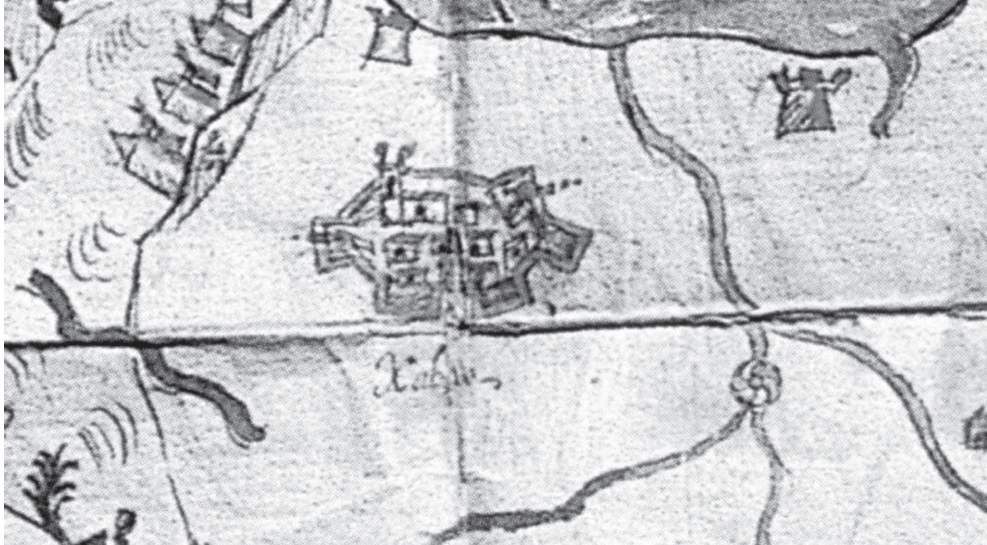
Fig. 1.- La vila de Xàbia segons un mapa manuscrit del segle XVII de l'Arxiu dels ducs de Medinaceli. S'hi distingeix la vila murada, dues torres litorals, els molins de vent i un d'aigua vora el riu.

El port de les Duanes (establertes devers 1825) és molt recent, tot i que la Caleta o la Fontana devien tenir un discret moviment —sempre subordinat a Dènia— a l'època medieval. El 1493 superaven la matriu encara que potser el seu paper siga exagerat al plànol del segle XVII de l'arxiu dels ducs de Medinaceli.